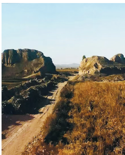
河北蔚县代王城遗址

西汉代国第一任代王是高祖刘邦的哥哥刘喜。代国是汉朝抵抗匈奴的前沿要地,公元前199年,匈奴入侵代国,毫无军事指挥才能的刘喜,根本无力坚守边疆,最后只好弃国独自逃回洛阳。刘邦对此大为恼怒,便下诏革去刘喜的王位,贬为合阳侯。刘邦委任韩信的部下阳夏侯陈豨为代国丞相,当时,赵、代乃天下精兵之所在,陈豨事实上成为统领重兵抗击匈奴的总指挥。