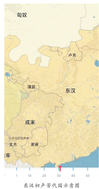
东汉初卢芳代国示意图

与之对峙。【评:一时间卢芳竟然成为东汉立国之初的劲敌。卢芳占高柳,不占代王城,说明东汉时代王城已经衰落,“代”的政治中心(郡治),已经西移百里,被高柳取而代之。据《后汉书》载,高柳之战十分凶险,史有“四战高柳”之说。应该说“高柳之战”对于这宗关于代国、代王、代郡,以及一切与“代”相关的叙事而言,是有节点意义的。也就是说,从此,古老的代都——代王城,已离开了我们故事的中心。】然而,世事沧桑的规律是,大势之所趋,顺势者昌,逆天者亡。卢芳虽然能靠匈奴的援助强悍于一时,但终究在东汉和平安定大势之下,开始从内部分崩离析了。卢芳手下众多将领,纷纷叛逃归汉。公元40年(建武十六年),成为孤家寡人的卢芳,不得已只好派使者前往东汉请降。当年十二月甲辰日,光武帝刘秀允准,赐封卢芳为代王。【评:这标志着“代王”封号的另一种政治用项——“招安”,被启动。】卢芳上书谢恩,言辞极为恳切:“臣劳过托先帝遗体,并在边陲。社稷遭王莽废绝,以是子孙之忧,所宜共谋,故遂西逃羌戎,北怀匈奴。单于不忘旧德,权立救助,是时兵革并起,往往而在。臣非敢有所贪视,期于奉承宗庙,兴立社稷,是以久借号位,十有余年,罪宜万死。陛下圣德高明,躬率众贤,海内宾服,惠及殊俗。以肺腑之故,赦臣罪罪,加以仁恩,封为代王,使备北藩。无以报塞重责,冀必欲和辑匈奴,不敢道余力,负恩负。谨奉天子玉宝,思望阙庭。”随后即起身上路入朝。向南行至昌平县,光武帝又下诏,命他停止入朝,改为明年朝见。卢芳心存疑虑和恐惧,于是再度反叛东汉。匈奴派数百名骑兵迎接卢芳及其妻子儿女到塞外,卢芳留在匈奴,居住十余年后,因病去世。【评:卢芳受封代王,应是历史上最短命的“代王”。汉朝(包括东汉)代王的分封,经历了刘喜被废,陈豨叛乱,刘如意改封,刘恒登基,太子刘参承袭王位,最后到卢芳这个冒牌货短命终结,笼而统之地可算是“第四代国”吧。整体看,这是一个“沉舟侧畔千帆过,病树前头万木春”的历史过程。嗟夫!】