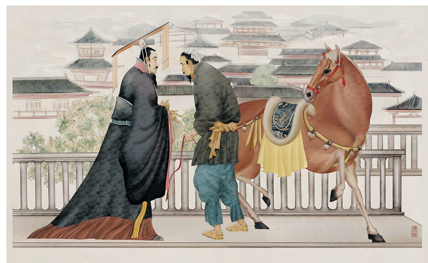
汉文帝刘恒悯民图

部落。后统一鲜卑内三部,自杏城(今陕西黄陵县西)以北八十里直至长城,夹道立碑,与晋朝分界而治。这个时期,匈奴后裔刘渊称王割据,率先建立了汉国。【评:此为“五胡十六国”之始。】永嘉四年(310年),晋朝并州刺史刘琨为了共同抵抗刘渊的匈奴汉国,派使者前来,将儿子刘遹送来作人质,与拓跋猗卢结成军事同盟。当年,联军大破白部鲜卑和匈奴铁弗部刘虎。为了感谢鲜卑的助力,刘琨奏请晋怀帝封拓跋猗卢为代公、大单于,以代郡作为他的食邑。拓跋猗卢以代郡距离盛乐过远,不能与部众连为一体,于是率领部落一万多家从云中进入雁门,向刘琨索求句注山以北的地区。刘琨不能控制他,遂把楼烦、马邑、阴馆、繁峙、崞县等五个县的百姓迁徙到句注以南,重建城镇,而将东接代郡,西连西河、朔方,方圆数百里的土地全部赠予拓跋猗卢。拓跋猗卢于是迁来十万户部民,用以充实这块土地,从此更加强盛。【评:这方圆数百里的沃野即是今之大同盆地,盆地之中心乃汉及曹魏之平城。】永嘉六年(312年)刘琨(汉王刘渊第四子)兴兵攻打晋朝太原郡,晋阳陷落,刘琨父母被杀。为了回报晋朝和刘琨,拓跋猗卢亲率20万大军,征讨刘琨,斩杀刘琨所部刘儒、刘丰、简令、张平、邢延等五员名将,刘琨十万“汉军”溃散,横尸数百里。刘琨得以收复晋阳。公元315年,晋朝正式颁发诏令,册封拓跋猗卢为代