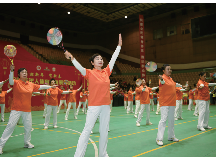
图为全国老年人体育健身展示活动现场。

此次活动由中国老年人体育协会主办,省老年人体育协会、市体育局承办,市老年人体育协会协办,旨在丰富老年人精神文化生活,增强老年人体质,推进健康中国建设。开幕式后,来自市老体协健身队、平城区老体协柔力球队、市健身气功协会、市武术协会等健身团队的近500名老年人进行健身秧歌、气功舞蹈、中医健身棒、太极拳、排舞等健身项目展示。参与活动的老年人精神矍铄、意气风发,展现出参与体育运动特有的健康活力。