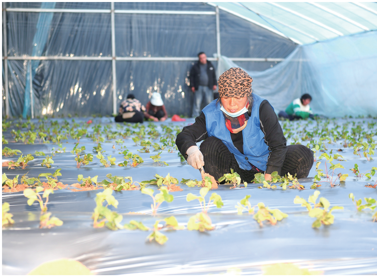
12月17日,灵丘县落水河乡三山村浩海辣椒产业大棚内绿意盎然,成熟的辣椒挂满枝头,村民穿梭其间,熟练地采摘辣椒,脸上洋溢着丰收的喜悦。近年来,灵丘县始终把产业发展作为推动乡村振兴和促进村民持续增收的有力抓手,落水河乡通过积极发展“大棚经济”,实现村民“春耕秋收”变“四季丰收”,为乡村振兴注入新活力。图为村民正在“轮作换茬”种植草莓。

悠悠万事,民生为重。“人民对美好生活的向往,就是我们的奋斗目标。下一步,我们将持续把民之所盼作为政之所向,把民之所需作为政之所为,踔厉奋发、开拓进取,让宜兴人民幸福生活的底气更足、质量更高。”宜兴乡党委负责人表示。