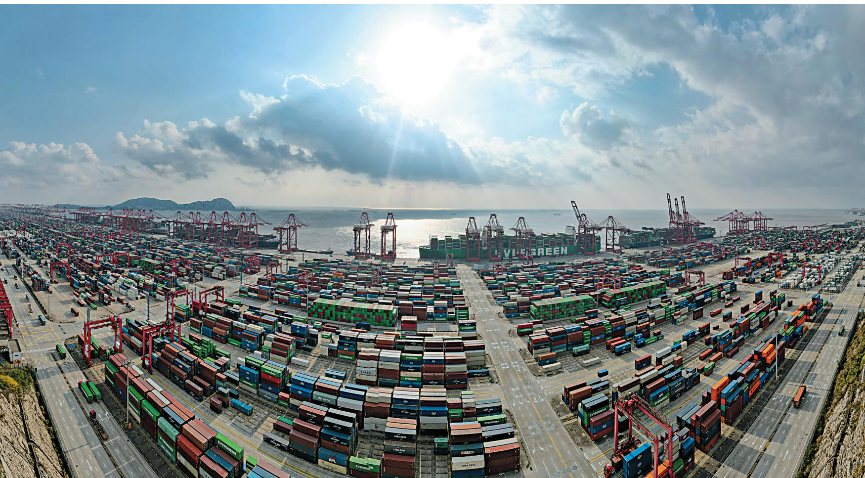
12月18日拍摄的洋山港(无人机全景照片)。12月22日,上海港2024年集装箱吞吐量突破5000万标箱,成为全球首个突破5000万大关的集装箱码头。