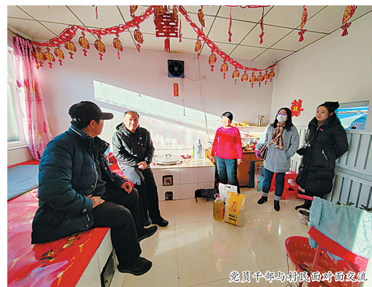
党员干部与村民面对面交流