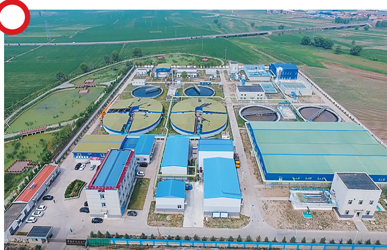
浑源县污水处理厂扩容及提标改造工程

项目于2019年12月17日开工，2020年9月29日完工，2021年1月7日通过交(竣)工验收，进入运营期。截至2024年底，累计处理污水4296.9万吨，处理并转运污泥3.3万吨。项目的实施显著改善了当地居民的生活环境，提高了居民的生活质量。为提高浑源县城市生活污水污水处理能力，实现污水排放长期稳定达标，切实打好污染防治攻坚战，着力改善桑干河支流浑河浑源段生态环境质量奠定了基础。