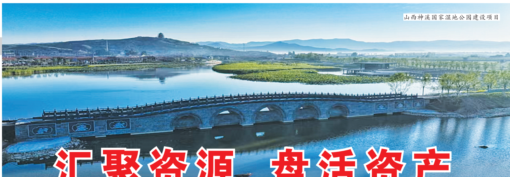
山西神溪国家湿地公园建设项目