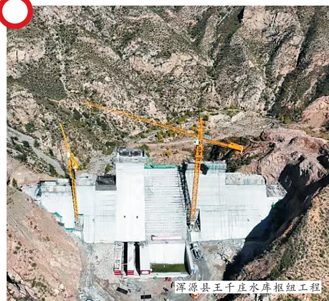
浑源县王千庄水库枢纽工程

项目建成后，可每年向生活及工业供水460万立方米，改善农业灌溉面积2.5万亩，每年供水669.6万立方米，为当地工业发展提供可靠水源和廉价电力，充分利用浑河地表水，逐步建立起地表水和地下水双水源的现代化城镇供水体系，为县城用水、工业项目顺利投产提供可靠水源，同时对保障农业增产增收，提高农民生活水平，促进浑源县经济社会发展具有重要意义。