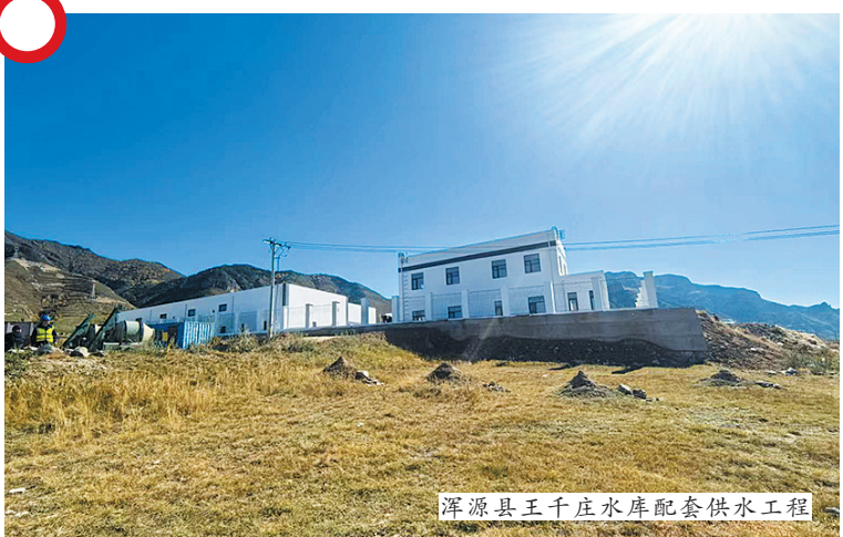
浑源县王千庄水库配套供水工程

本工程建成后每年可向静脉产业园年供水量73.4万立方米，向浑源县城年供水量300.3万立方米，向许村、武村、东辛庄、丰台铺、张庄和王千庄等6个村年供水85.9万立方米，年供水量可达459.6万立方米。