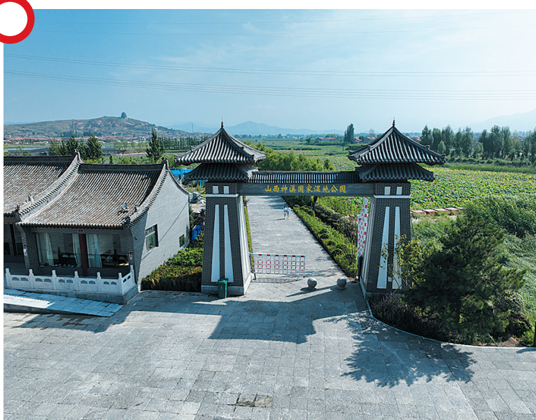
山西神溪国家湿地公园建设项目

总投资37072.06万元的山西神溪国家湿地公园建设项目于2022年7月开工建设，目前该项目正加速建设中，现已完成工程总量的92%。该项目建成后，将大大改善当地生态效益，提升科普文化教育水平，推动浑源县旅游业特别是生态旅游业的快速发展。