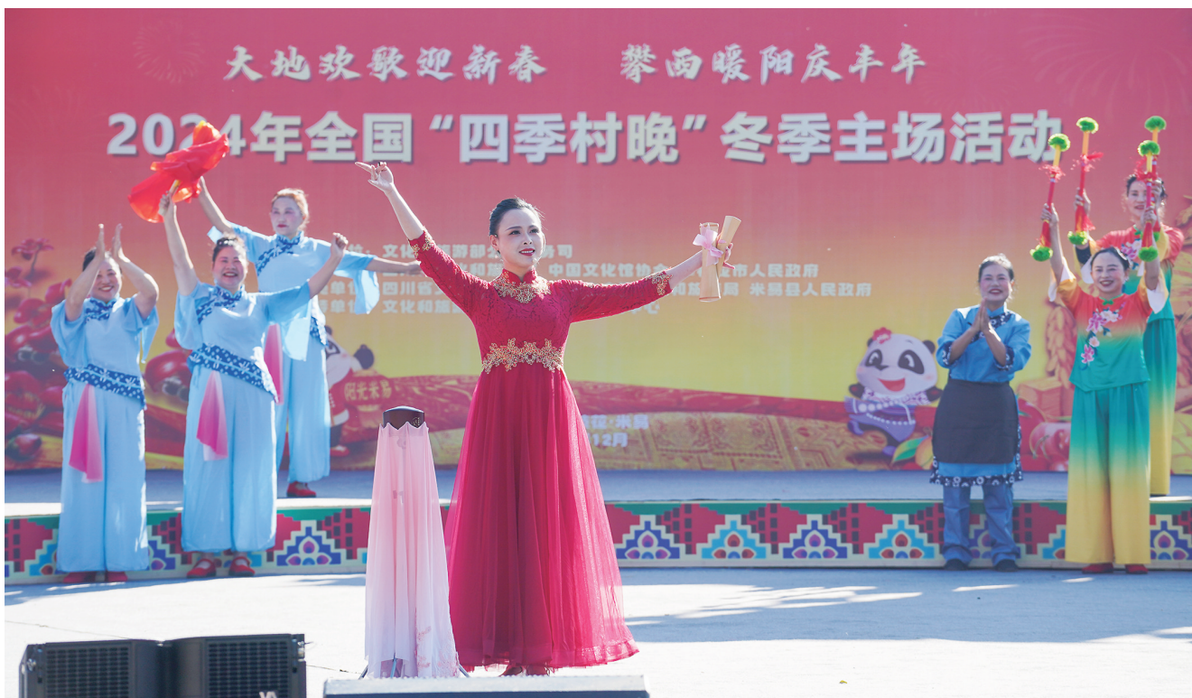
12月30日，2024年全国“四季村晚”冬季主场活动在四川攀枝花市米易县龙华村举行，主题文艺展演、乡村年货大集、春节文化展示等活动精彩纷呈，展现了和美乡村新面貌以及幸福农民新生活。图为来自广安市岳池县的演员在2024年全国“四季村晚”冬季主场活动上演出。

本报讯（记者 锦秀）近日，经会议审议通过，市青年志愿者协会当选为中国青年志愿者协会第六届单位会员，这也是我市唯一入选的志愿服务组织。 中国青年志愿者协会成立于1994年，是共青团中央主管的，我国成立时间最早、规模最大的志愿服务组织之一。此次市青年志愿者协会的成功当选，不仅是共青团中央、中国青年志愿者协会对该协会志愿服务工作的肯定与认可，更是对我市青年志愿者的激励和鞭策。 市青年志愿者协会成立于2009年7月15日，是由从事社会服务事业的各界青年和社会公众组成的全市性、非营利性社会团体，是市青年联合会、山西省青年志愿者协会的团体会员，接受团市委和市民政局的业务指导和监督管理。该协会成立以来，组建了山西锦世联行志愿服务队、大同黄水供水志愿服务队等多支青年志愿者特色服务队。近年来，该协会以“学习雷锋、奉献他人、提升自己”来推进青年志愿者行动，先后开展了“爱心助考”“敬老、爱老”“关爱特教儿童”“暖冬行动”等特色志愿服务活动，在助力大同黄花产业、创建文明城市、第二届全国青年运动会大同赛区、成龙国际动作电影周等重大活动和重点工作中，青年志愿者已成为大同城市建设中必不可少的一支队伍。截至目前，该协会共有13.3万余名志愿者，组织志愿服务活动246次，开展招募活动280次，累计志愿服务时长达130.4万余小时。