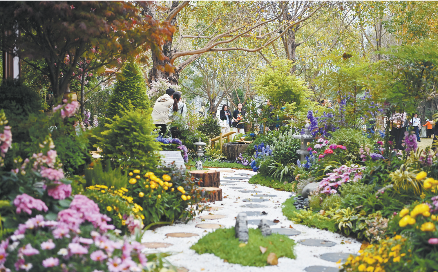
3月28日，观众在广西南宁市南湖公园体验花境作品。 当日，主题为“疗愈花园”的2025年第五届南宁（南湖公园）花境大赛在南宁市南湖公园举行。24件花境作品各以30平方米的自然场景为布置对象进行展示设计，打造沉浸式自然疗愈空间，让群众体验“公园+”模式为城市绿地注入的活力。

烂水沟等区域改造，打造出壹里小吃街，吸引四川各地美食汇聚入驻。2022年，战旗村和四川省旅投集团联合打造的天府战旗酒店正式开业运营。 市农业农村局负责人表示，战旗村作为中国乡村振兴的典型范例，其发展经验对我市推动乡村振兴和城乡融合发展具有重要的借鉴意义。