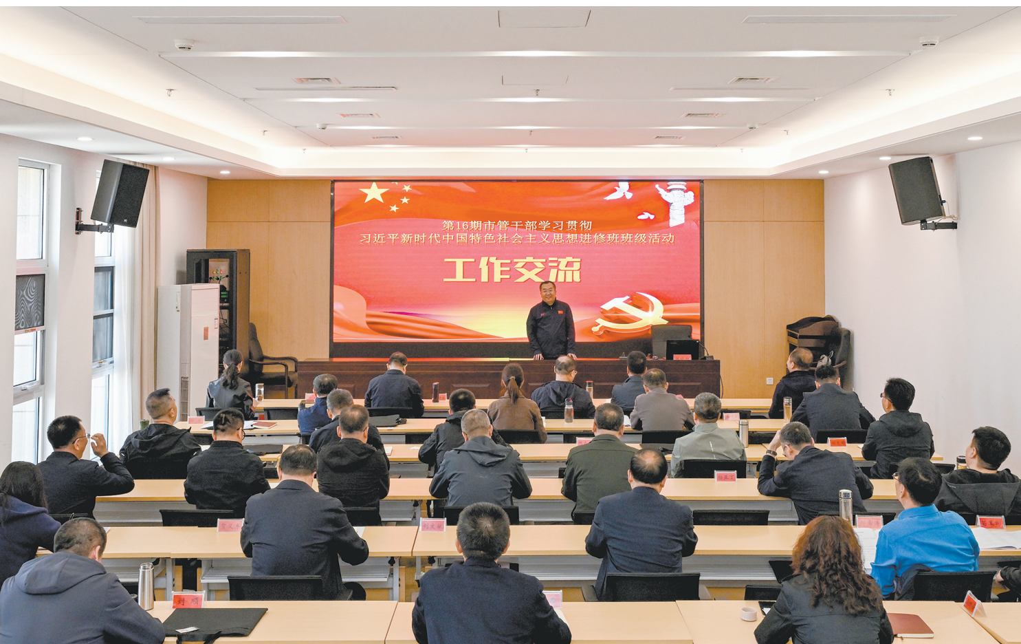
4月15日下午,在第16期市管干部学习贯彻习近平新时代中国特色社会主义思想主题教育培训班活动中,各行业各县区处级干部、各系统科级干部、各系统科级干部、各系统科级干部,围绕教学授课内容及个人工作和成长经历分享工作经验、交流心得体会,互相取长补短,现场气氛热烈,活动反响良好。 本报记者 张燕 通讯员 高扬摄

体重管理年”全民健康行动开展肿瘤防治早筛、早诊、早治和科学控制体重等系列活动。同时,积极推进省政府民生实事之消化道健康筛查、“城市癌症早诊早