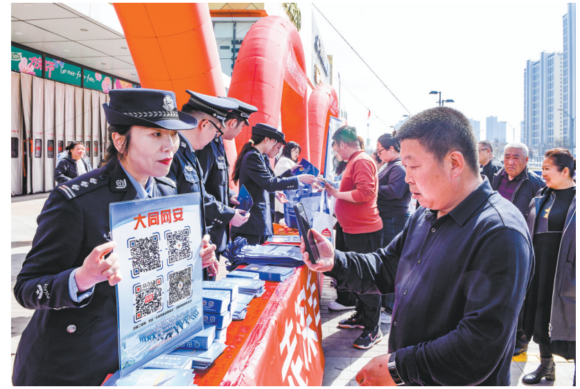
图为公安民警向市民宣传总体国家安全观和国家安全法律法规。

发放宣传资料、现场法律咨询、讲解典型案例……昨日,市检察院在万达广场开展全民国家安全教育日普法宣传活动,通过多种形式向市民宣传国家安全和相关法律知识,进一步增强市民自觉维护国家安全的意识和能力。活动现场,市民纷纷领取宣传资料,了解相关法律知识。“国家安全看似离我们很远,实则就在我们身边,有可能不经意间就触及了这条红线。我们要通过宣传活动让市民明白哪些能做、哪些不能做,以及身边有哪些危害国家安全的行为、发现危害国家安全行为或线索该怎么举报,共同筑牢国家安全堤坝。”市检察院第二检察部副主任刘爱林说。