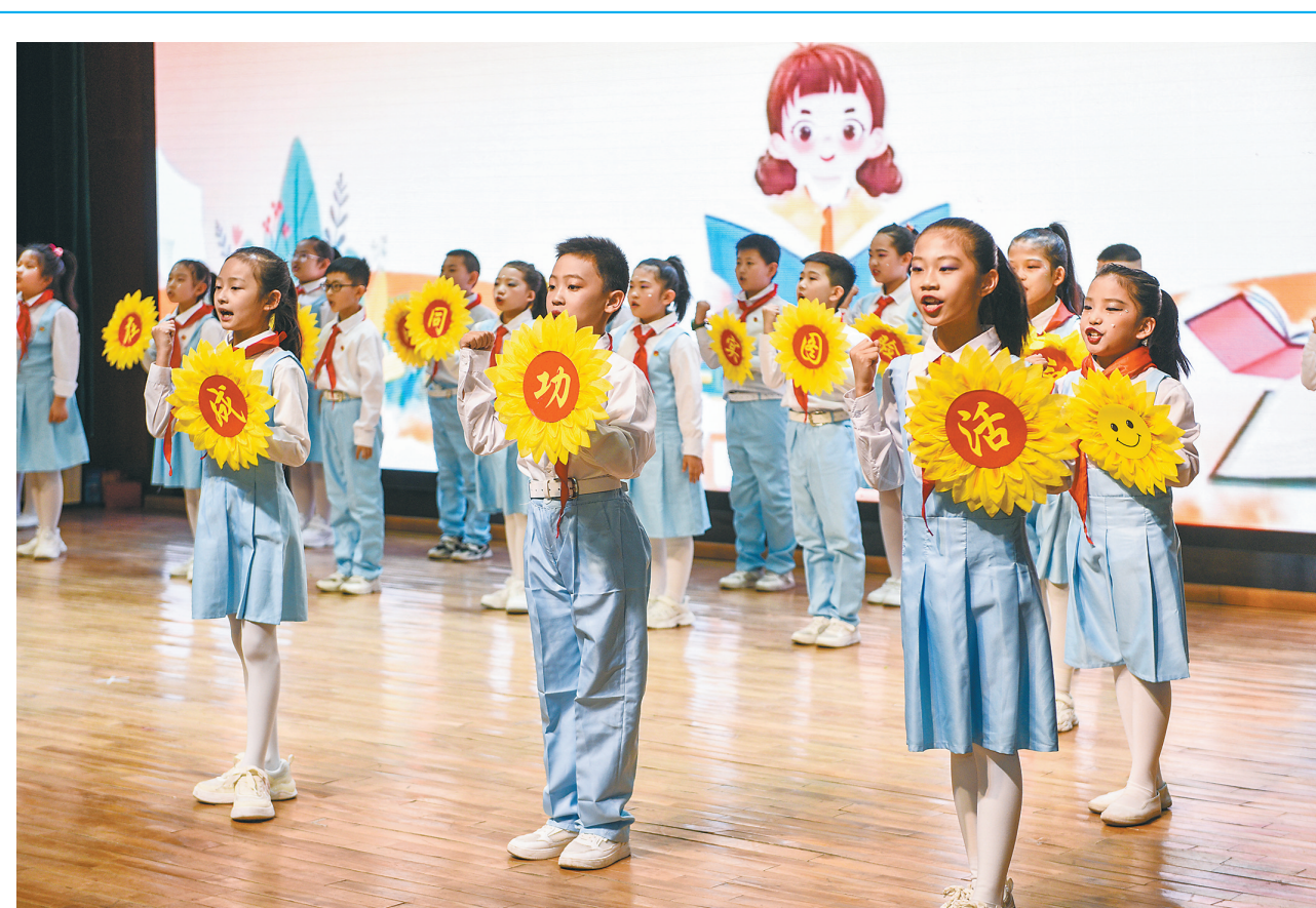
为激发学生阅读兴趣，营造书香校园氛围，4月18日，云冈区实验小学在市图书馆开展以“书香润童心 阅读伴成长”为主题的读书会系列活动。活动通过名师讲座、互动分享、参观研学等引导学生培养良好阅读习惯，提升综合素养。图为读书会系列活动中，学生表演情景剧《书香童年》。