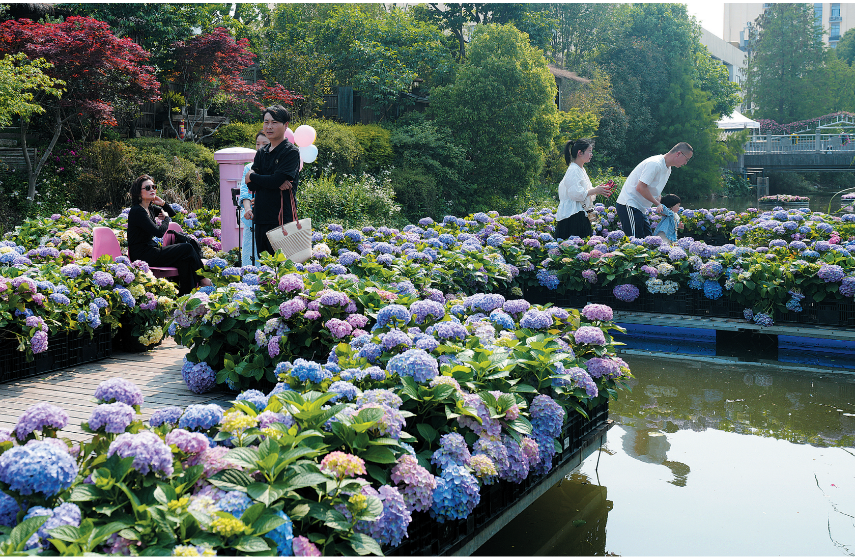
4月28日，2025世界花园大会开幕式在浙江省海宁市举行，本届花园大会以“花园经济 循环往复”为主题，总展示面积50万平方米，包括设计师花园、商家花园、植物品种展等。图为，人们在花园大会绣球展区参观。

术协会开展“快闪”武术表演，丰富游客文化体验；景区志愿者（云中青年协会）在九龙壁、府文庙、纯阳宫等核心景区，协助工作人员维持游览秩序，为游客提供路线指引、景点介绍等服务，提升景区服务效能；交通志愿者（退役老兵服务队）在圆通寺、鼓楼、代王府等主要交通路口，协助交警疏导人流车流，保障行人安全及道路畅通，缓解节日交通压力；文艺志愿者队伍则在清远门外，联合市党群服务中心开展惠民文艺演出，每天上午午各一场，并设立点位开展志愿服务。