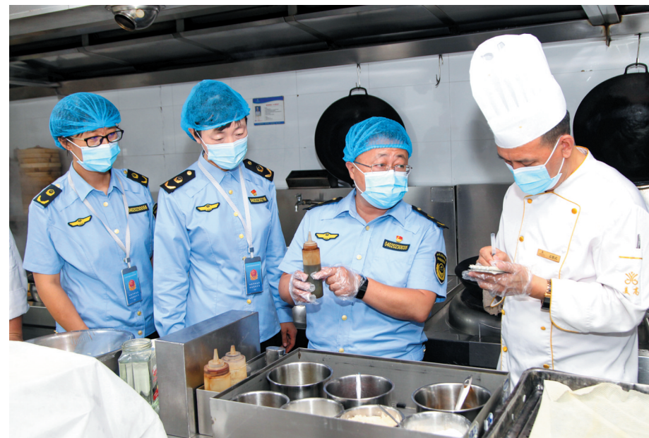
图为平城区市场监管局工作人员正在检查餐饮安全。