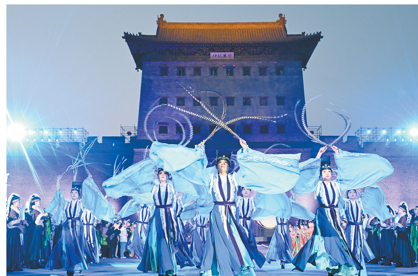
4月30日晚，实景演艺《因为大同》开城盛典盛大开启。