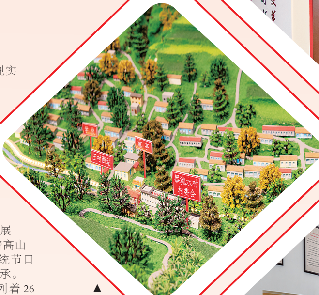
黑流水村乡村记忆馆里沙盘模型

同时，记忆馆内不仅陈列着26个搬迁村的集体记忆，更通过有机杂粮展销区、五大产业影像墙等板块，展示着高山镇乡村振兴的现实图景。开馆以来，已吸引接待团体72批、村民近万人次，成为青少年了解本土文化、搬迁群众寄托乡愁的重要载体。