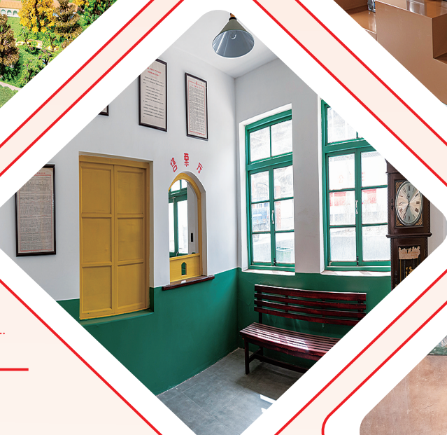
黑流水村乡村记忆馆里模拟的老车站售票口