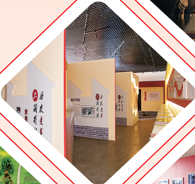
南村记忆馆内部场景