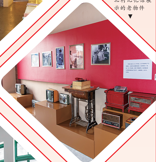
北村记忆馆展示的老物件