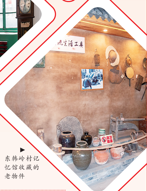
东韩岭村记忆馆收藏的老物件