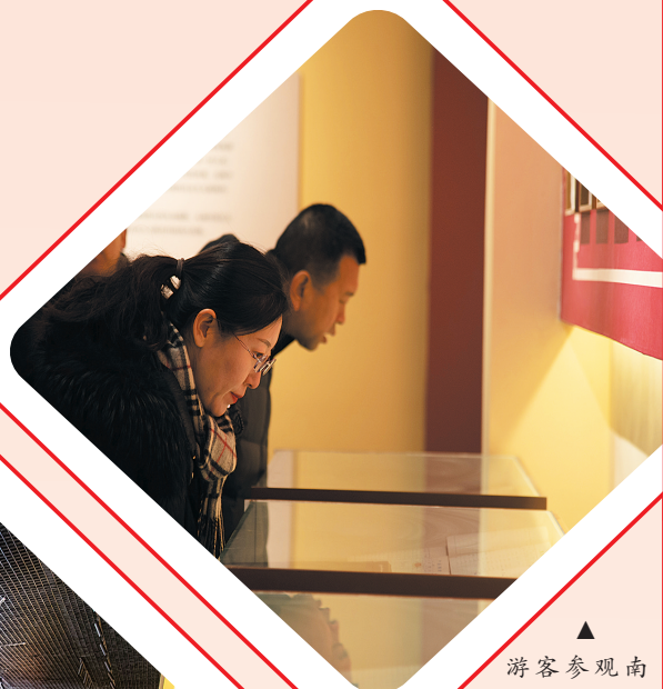
游客参观南村记忆馆旧账册展台