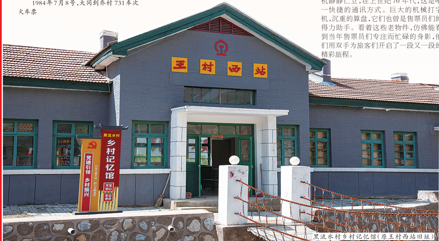
黑流水村乡村记忆馆(原王村西站旧址)