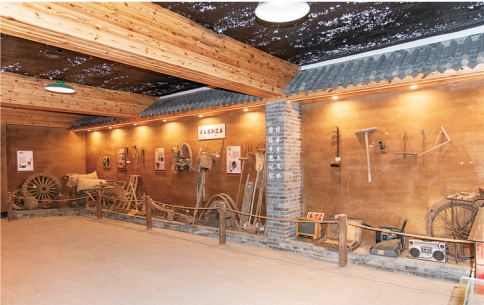
本版撰文/闫昌