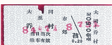
1984年7月8号，大同到乔村731车次火车票