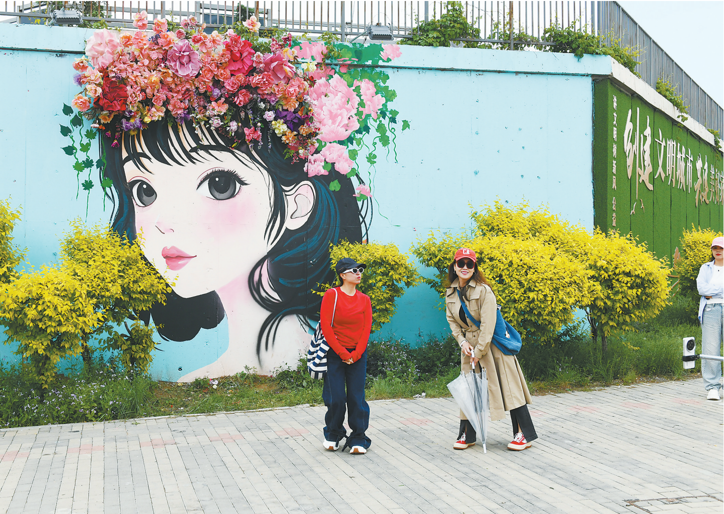
近日,位于智家堡森林公园西北角的“簪花少女”彩绘墙一经亮相,迅速成为市民、游客的又一网红打卡点。 “簪花少女”彩绘墙由我市热心公益的彩绘师团队创作,此前,该团队还创作过《黑神话:悟空》《哪吒2》《红楼梦》等主题公益彩绘墙。图为市民、游客在彩绘墙前拍照打卡。