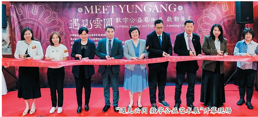
“遇见云冈 数字公益艺术展”开幕现场

本报讯（记者 赵喜洋）5月27日，“遇见云冈 数字公益艺术展”在香港西九龙文化区（西九龙站）拉开帷幕。此次展览由中国文物保护基金会、云冈研究院联合主办。中国对外文化集团有限公司、紫荆杂志社联合承办，中国对外演出有限公司、北京中创文旅集团、遇见博物馆协办。