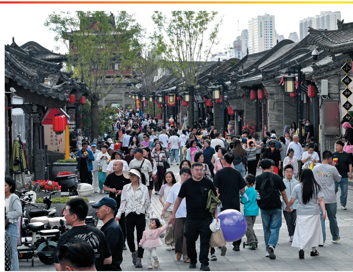
6月1日是端午假期第二天，我市各景区景点游人如织。在大同古城内的华严广场、鼓楼东西街、东南邑等景区，游客穿梭于街巷间，品尝特色美食、打卡特色街区，沉浸式体验千年古都烟火气息。在云冈石窟、九龙壁、博物馆等历史文化景区景点，市民、游客体验各民族交往交流交融的历史内涵，感受中华优秀传统文化博大魅力。本报记者 张燕伟 于宏 戎禹仁摄