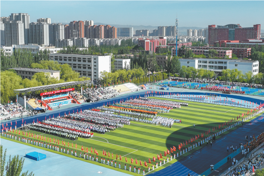
图为大同大学运动会开幕式现场。