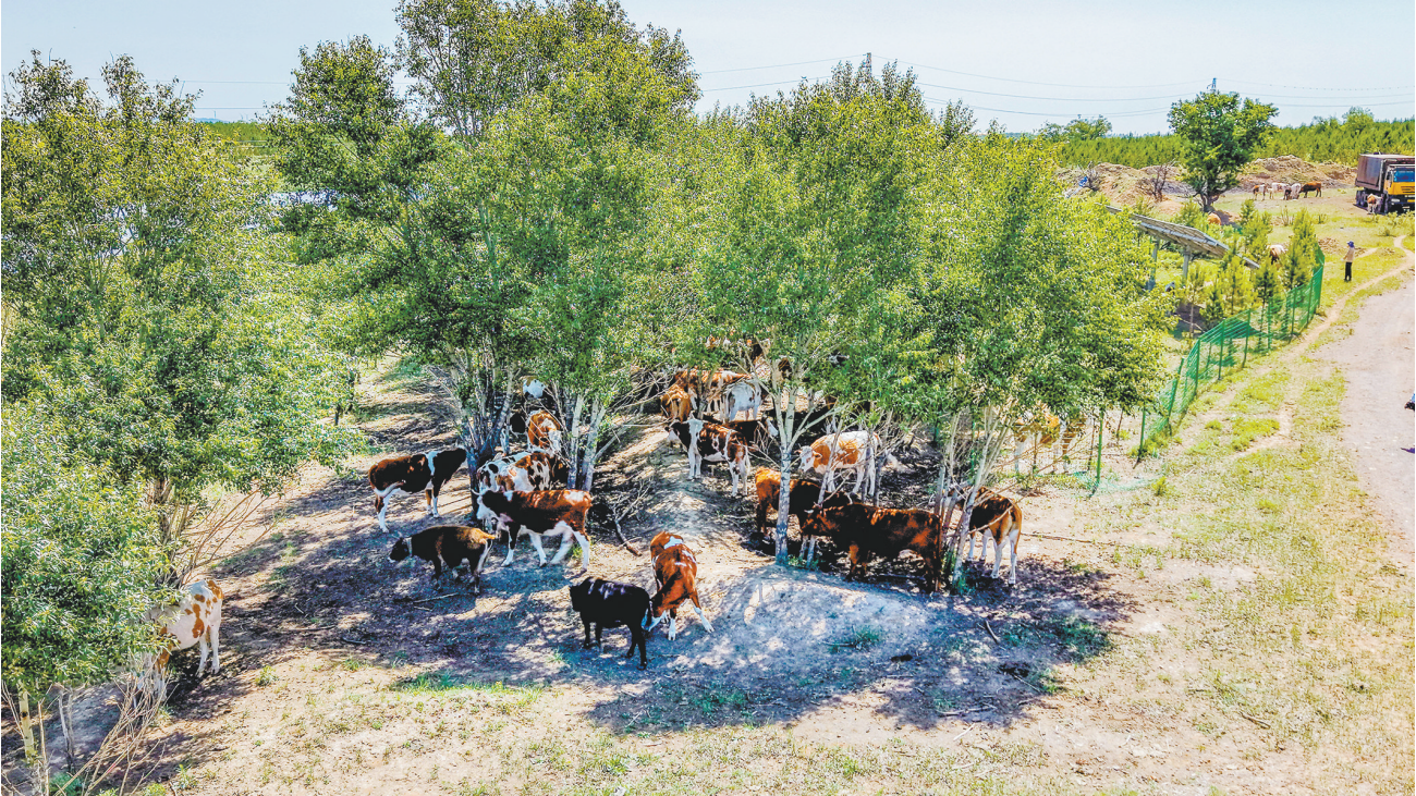
6月4日，云冈区高山镇罗家辛窑村瑞和致富种养专业合作社饲养的西蒙塔尔肉牛在牧场尽情吃草。该合作社以“合作社+农户”发展模式，不断探索多元经营路径，大力发展特色养殖产业，不仅带动当地村民就业，还增加了村民收入。

本报讯（记者 张志忠）6月5日，京能大同热力有限公司在市党群服务中心举办“六五”环境日主题活动，带动全社会共同关注和参与环境保护。 近年来，京能大同热力有限公司始终将环保工作视为重中之重，在技术革新上积极探索并应用先进供热技术，减少对大气的污染；不断提升设备自动化控制水平，实现能源高效利用，从供热领域为保护环境作出更大贡献。在日常运营管理中，建立严格的环保监督体系，与环保部门保持密切沟通，不断完善自身环保工作；注重对干部职工环保意识的培养，通过组织各类环保培训、知识讲座，让每位职工成为环保工作的坚实守护者。 “将继续秉持绿色发展理念，持续加大环保投入，不断完善环保管理制度，提升企业整体环保管理水平。”该公司相关负责人表示。