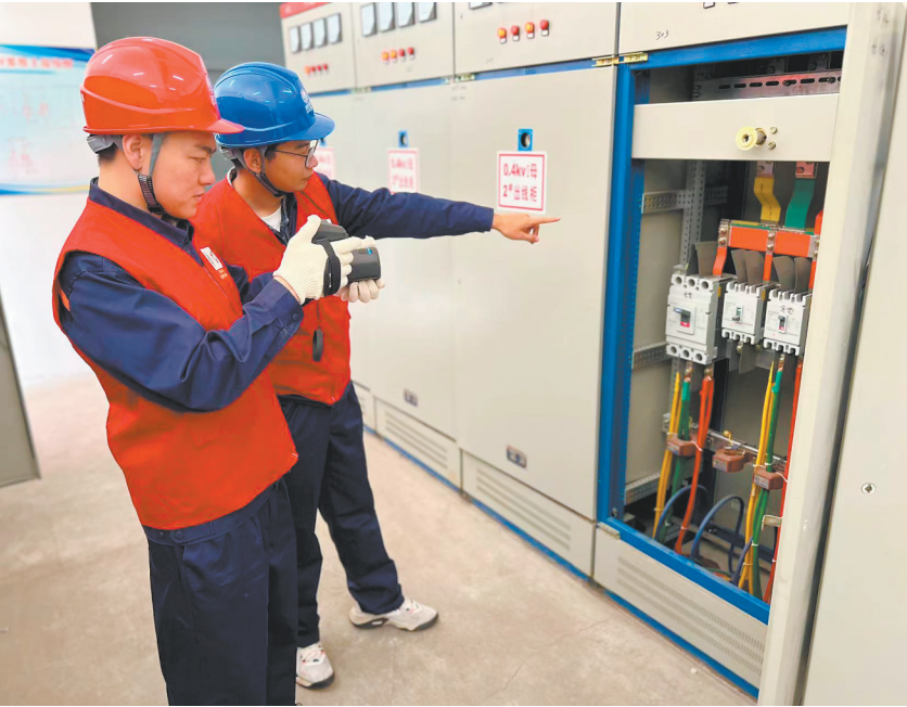
图为国网大同供电公司工作人员在大同一中考点检查电力设施。