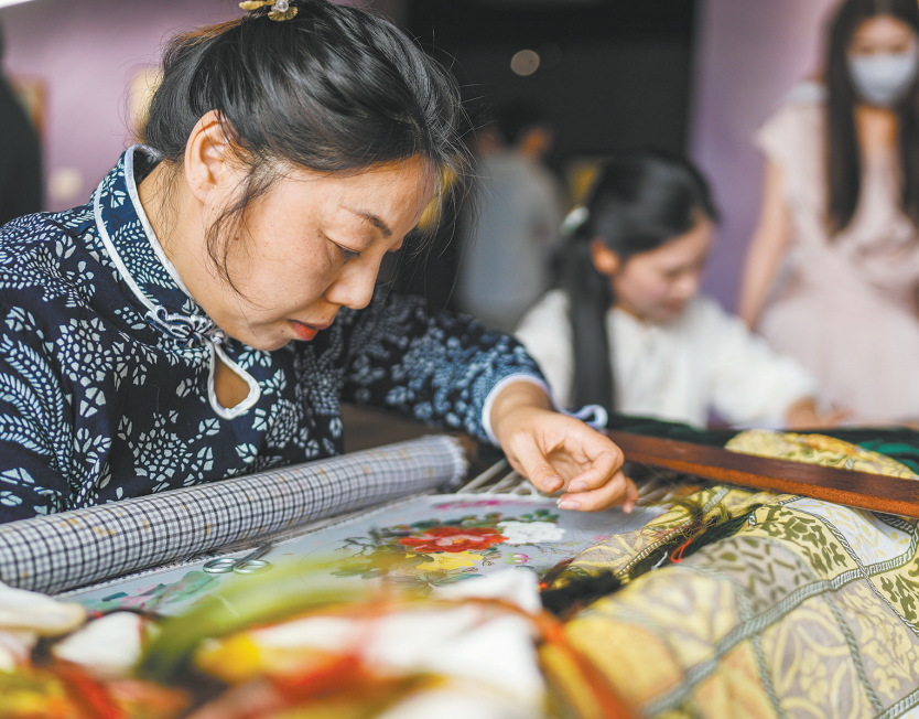
6月6日，在东台西溪天仙缘景区内的东台发绣展示馆，绣娘现场展示绣工。东台发绣又称“墨绣”，是以人发为“线”，用苏绣传统针法进行绣制的一种传统刺绣工艺，作品质感纹理别具一格。它源于唐代信女用发丝绣制佛像的习俗，至今已有1300多年历史。2021年，东台发绣被列入国家级非物质文化遗产代表性项目名录。