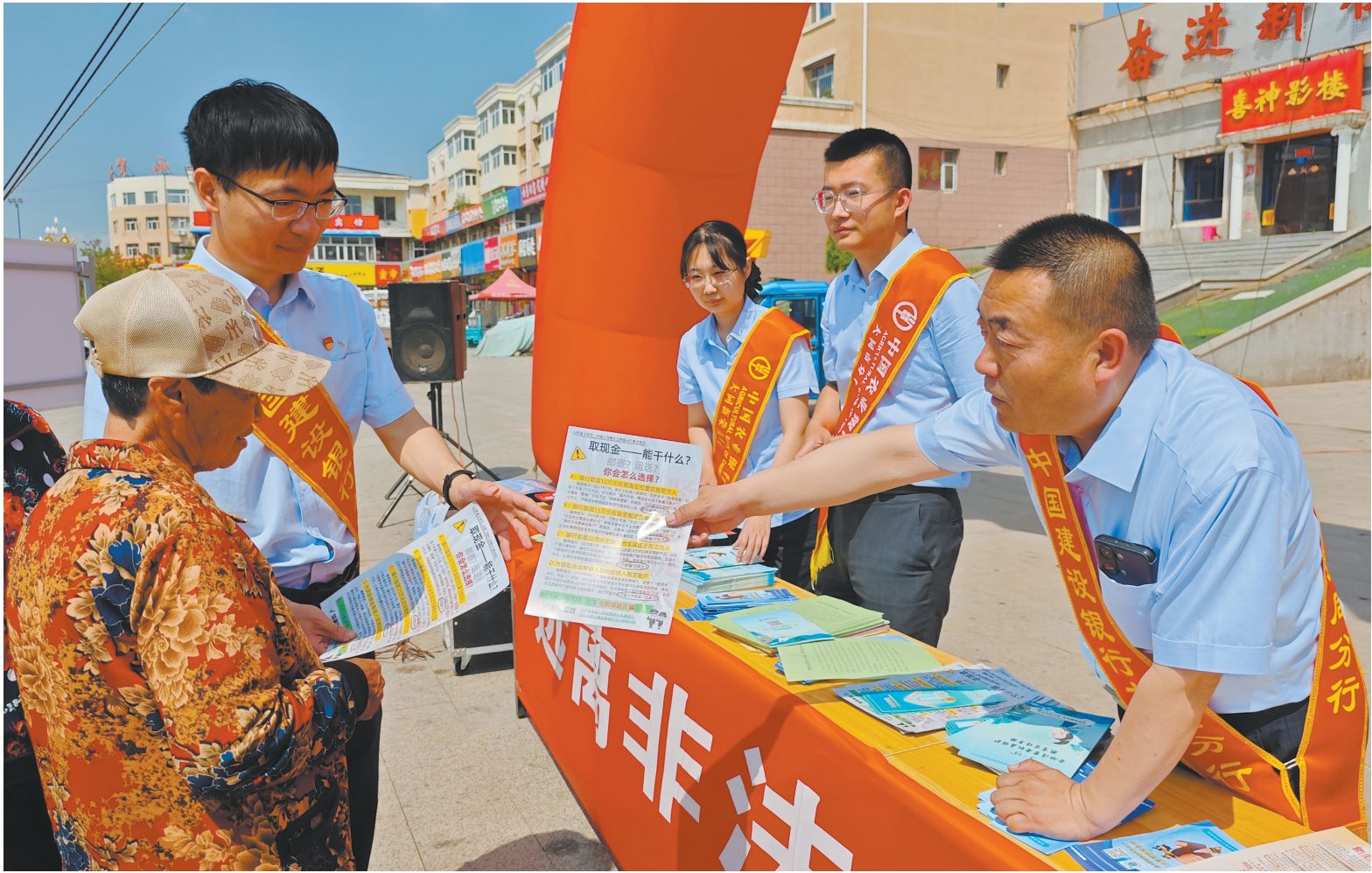
6月13日，围绕“守住钱袋子·护好幸福家”宣传主题，新荣区政府联合农行、建行、农商行、邮储银行等金融部门，在该区礼堂广场开展防范非法集资宣传月活动。活动中发放宣传资料6000余份，引导群众增强风险防范意识，提高自我保护能力。图为建行工作人员为群众发放防范非法集资宣传资料。

从酸枣结出“金果子”到光伏板下长出“绿银行”，从藏香猪“跑”开市场到露营经济点燃乡村活力，云州区的创新实践印证了“绿水青山就是金山银山”真理。在这片希望的田野上，生态保护与经济发展协奏曲越奏越响亮。