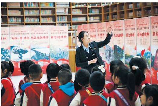
本版文字：韩云峰 李明璇 郑苗苗

文化讲座、知识竞答、读书分享会等阅读活动持续开展，点燃了大众阅读热情，书香萦绕，不断丰富着这座城市精神与文脉，古都大同焕发新的活力。