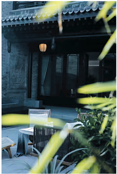
全新接待中心 营造多元交流空间