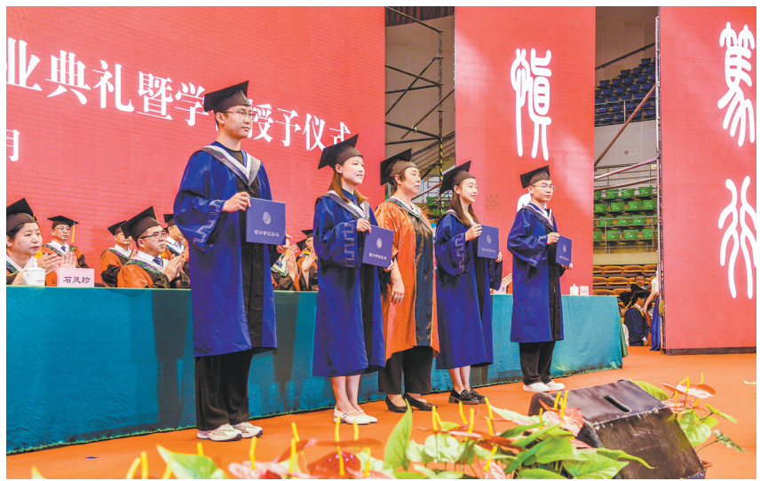
图为校领导与毕业生代表合影。

毕业典礼在校歌《使命》的激昂旋律中圆满落幕。毕业生纷纷与老师、同学合影,定格青春美好瞬间。