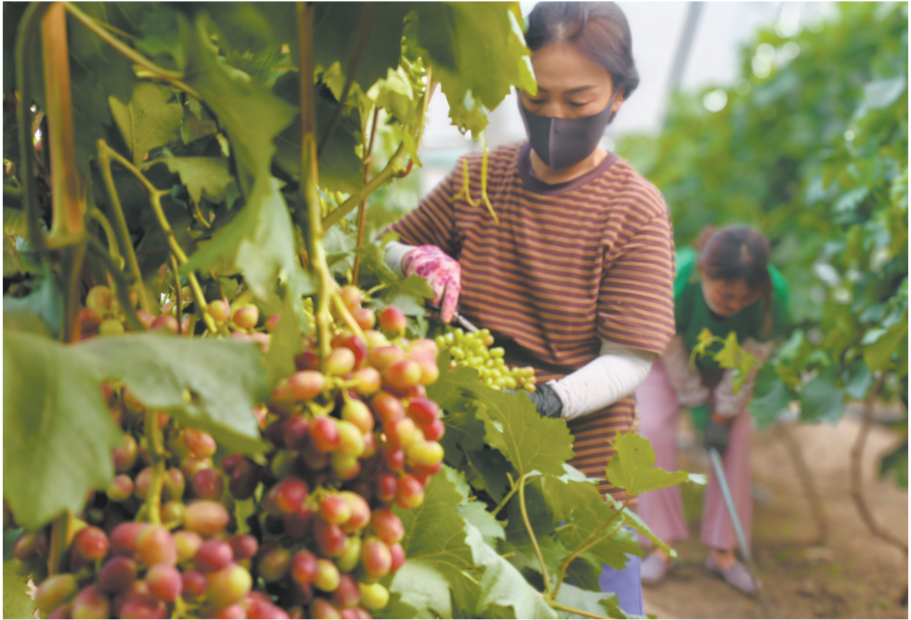
6月18日,在灵丘县武灵镇代庄村祥鹏农业有机葡萄种植基地,果农正抢抓农时进行管护作业,为增产丰收打下坚实基础。该基地占地10亩,种植黄金玫瑰、巨胜、冰美人等20多个品种,全程采用有机种植技术。7月开始,不同品种的葡萄将陆续成熟。据了解,这是该基地规模化种植的第3年。

大同市军队离休退休干部休养所军队退休干部郭乐尔同志,因病于2025年6月18日逝世,享年86岁。 郭乐尔同志,河北清苑人,1939年11月出生,1958年1月入伍参加工作,1961年9月加入中国共产党。曾任总参管理局生产管理处副局级助理员。 定于2025年6月20日上午7时在大同市殡葬服务中心2号告别厅向郭乐尔同志遗体告别。