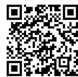
《2025年公益性岗位招聘单位统计表》