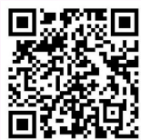
《大同市市直公益性岗位招聘就业困难人员申请表》