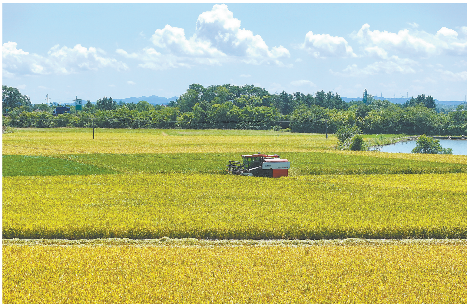
7月3日，在湖南省衡阳市衡山县白果镇，村民驾驶收割机收割早稻（无人机照片）。湖南省衡阳市衡山县种植的早稻次第成熟进入收割季，当地村民抢抓晴好天气驾驶农机收割早稻。