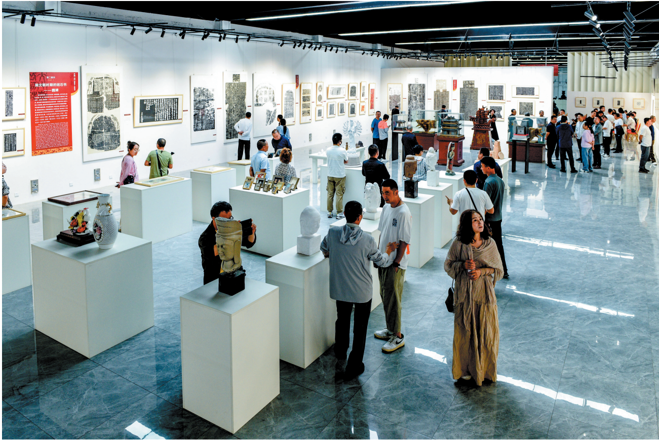
图为大同大学铸牢中华民族共同体意识魏碑书法源流展现场。