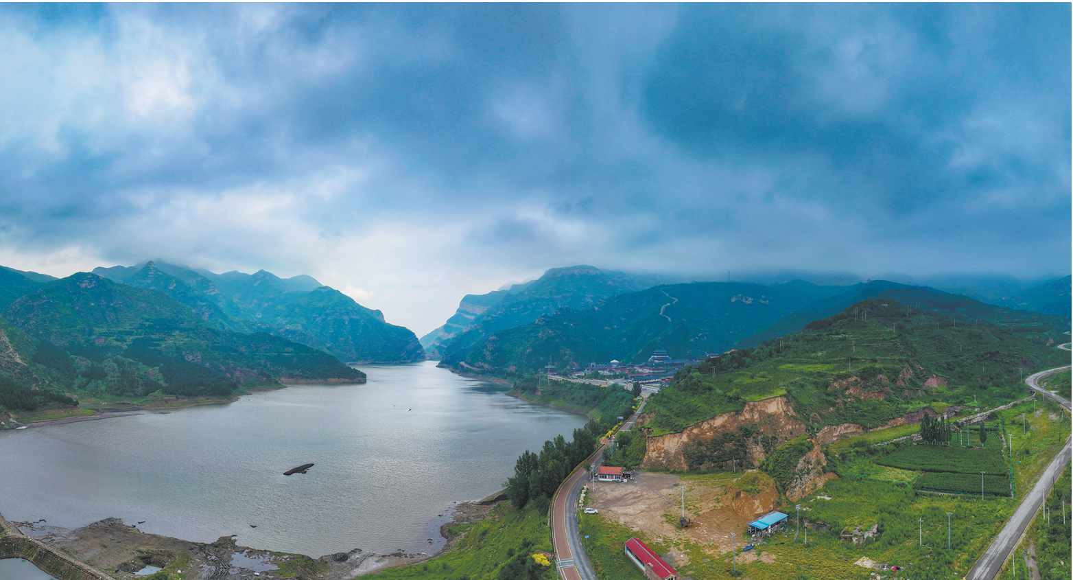
7月7日，恒山景区云雾弥漫，山峰若隐若现，宛如仙境。在云雾与光影交织下，恒山展现出独特魅力，成为游客眼中的绝佳美景。

天镇县星源学校将急救知识纳入必修课程，定期邀请医护人员授课；建立急救技能实训室，配备专业器材、组织实操训练；开展急救知识讲座、技能竞赛和应急演练，通过广播、海报、公众号等多渠道普及急救知识。灵丘一中在主教学楼二楼配备AED设备，组织专业人员开展使用培训；每年邀请