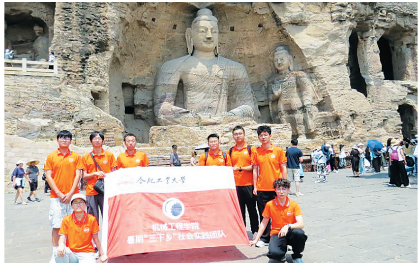
合肥工业大学机械工程学院实践团20窟前合影

为深入探究云冈文化的传承脉络，并为其创新发展注入新活力，7月7日至9日，合肥工业大学机械工程学院“溯云冈文脉薪火，铸文化自信根基”暑期三下乡实践团一行8人，在云冈石窟开启了一场研学探索之旅。