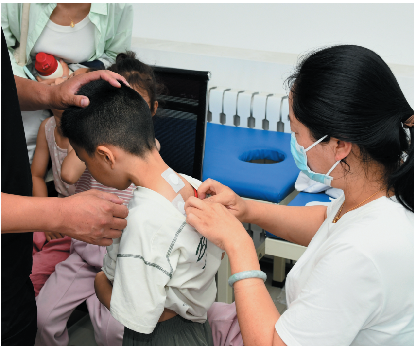
图为7月20日，市民在市中中医医院“冬病夏治”。

据市中中医医院专家介绍，三伏贴的核心理论源自《黄帝内经》“春夏养阳，秋冬养阴”。此时将辛温散寒之药贴于特定穴位，药物更易透过肌肤渗入经络，鼓舞人体阳气、提升正气，协调脏腑功能，达到“冬病夏治”目的。同时，三伏贴不是普通膏药，不是哪里不适贴哪里，中医讲究辨证施治，不同的症状需选取不同的穴位敷贴，精准选穴离不开扎实的中医理论基础及丰富的临床经验，因此，建议市民选择专业中医师敷贴三伏贴。