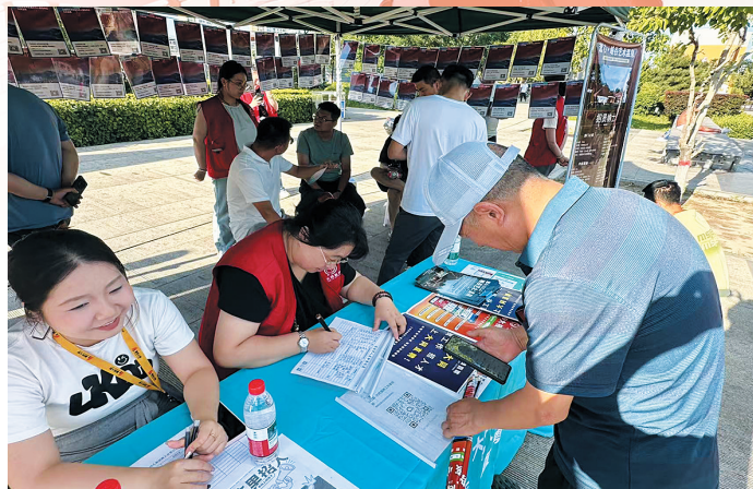
云冈区退役军人事务局开展“戎装归云冈 岗位启新程”社区送岗活动。

“鹊桥会”搭得巧： 就业桥梁稳稳搭起。采用“线上+线下”结合方式组织开展招聘活动，通过直播平台为退役军人提供简历投递、政策咨询等“云”端服务，在满足不同年龄段退役军人求职需求的同时，也为用人单位拓宽了人才选拔渠道。去年组织开展14场户外招聘活动，为退役军人提供了许多优质岗位。