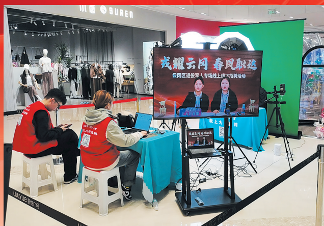
云冈区退役军人事务局举办“戎耀云冈 春风职达”网络招聘会。