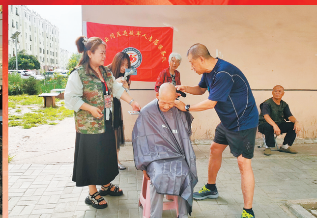
云冈区退役军人志愿服务队开展免费理发活动。