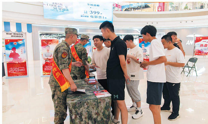
年轻人们询问征兵流程。

络，及时了解困难退役军人思想和生活状况，对因大病、就业困难和无劳动能力等退役军人建档立卡，确保帮扶对象精准全面、援助帮扶及时到位。2024年共对106名困难退役军人进行困难帮扶援助，共计帮扶金额26.3万元。积极开展“法润老兵”（山西行动）专题宣介会，法律服务的坚实后盾让退役军人权益保障之路更加清晰、宽广。在去年开展的“情暖老兵·守护光明”公益活动中，在多个街道及其下属社区、退役军人服务站组织开展眼健康知识宣讲及义诊活动，共为1983名服务对象提供眼健康义诊。