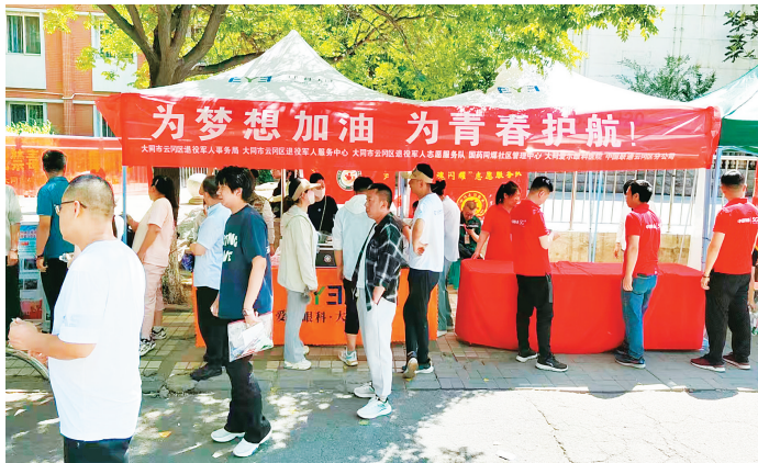
云冈区退役军人志愿服务队护航中高考。

军人那股韧劲儿和闯劲儿艰辛创业，如今在环卫服务领域开拓出一片容纳860余人的事业天地，用实际行动诠释着退役军人的责任与担当。再看那高高飘扬的云冈区退役军人志愿服务队旗帜：节假日里，他们是景区的“文化使者”，热情地为八方游客讲述着家乡故事；中考时，他们的“爱心送考”车队整装待发，为莘莘学子的圆梦之路保驾护航；困难退役军人家中，总有他们忙碌的身影，送去物资，更送去关怀与希望……从“最可爱的人”到“最可亲的志愿者”，身份转换间，他们依旧担当永恒、忠诚如磐！