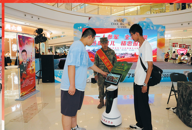
征兵办展示“同小兵”智能机器人。