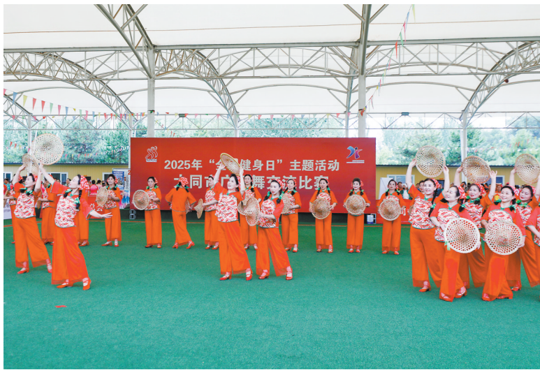
图为2025年全市广场舞交流比赛现场。

本报讯（记者 陈杰）今年8月8日是全国第17个“全民健身日”。昨日上午，2025年“全民健身日”主题活动全市广场舞交流比赛在市民健身中心门球场举行，全市22支代表队近400名广场舞爱好者以活力四射的表演展现全民健身风采，赢得现场观众热烈喝彩。 此次活动是市第六届全民健身运动会、2025年全市群众文化活动体育赛事系列活动之一，由市政府主办，市体育局、市体育总会、市老体协承办，旨在以“全民健身日”为契机，深入推进“体管理年”专项活动，着力构建更高水平的全民健身公共服务体系，积极营造全民参与健身、共享健康生活的良好社会氛围。 比赛在欢快的音乐声中拉开帷幕。清远艺术团队、新荣御河队、云冈区老体协队、左云县老体协队等参赛队伍依次登场，伴着动感旋律演绎各具特色的广场舞，赢得围观市民和游客的热烈掌声。评委将根据参赛队动作编排、服装音乐、现场表现等要素进行综合评分，最终评出一、二、三等奖。