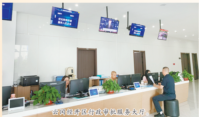
云冈经开区行政审批服务大厅。

不仅如此，为了提高招商效率，云冈经开区还充分发挥招商“三大平台”的作用，整合各类招商资源，实现信息共享、优势互补。仅仅今年上半年，就新签约项目18个，总投资35.68亿元，为经济发展注入了强劲的动力。