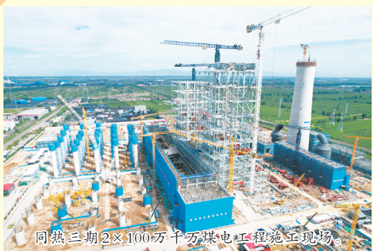
同热三期2×100万千瓦煤电工程施工现场。