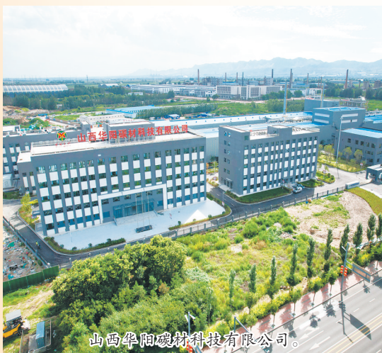
山西华阳碳材科技有限公司。