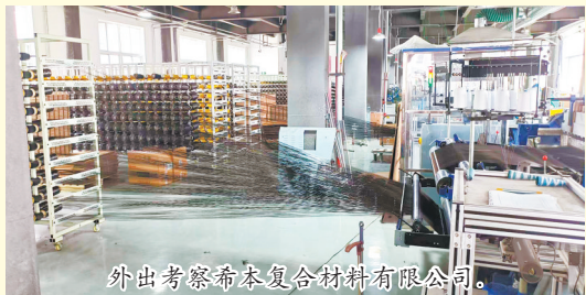
外出考察希本复合材料有限公司。