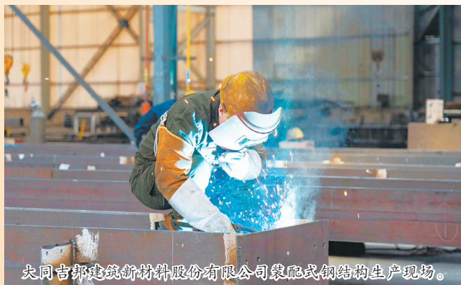
大同吉邦建筑新材料股份有限公司装配式钢结构生产现场。