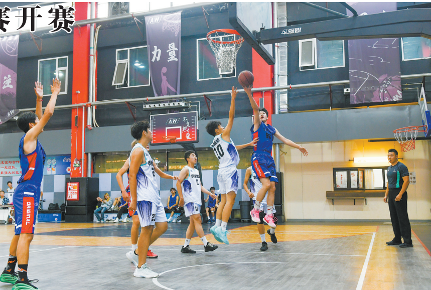
图为全市第八届“未来之星”青少年阳光体育大会篮球赛U17组常青中学队对阵奥体体育队比赛现场。

的乒乓球、跳绳、踢毽子传统三项赛，发展为包括篮球、足球、乒乓球、游泳、跆拳道等十余个竞赛项目，每年吸引近万名青少年踊跃参与，成为我市规模较大的综合性青少年体育盛会。 比赛为期7天，按年龄设置组别，竞赛项目有小篮球、五人制篮球，参赛者年龄最大的18岁、最小的6岁。首日揭幕战在奥体·城市之光篮球运动中心万达店和南环桥店同步打响，运动员全情投入，精准的传球与敏捷的突破动作频频引发观众喝彩。