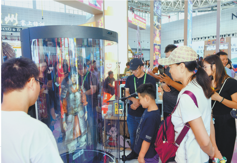
图为观众正在与大同花木兰“3D超写实数字人”互动。

这款“黑科技”设备打破传统展示的平面界限,以全息技术为核心,将花木兰相关内容以立体、生动的形式全新演绎。当观众靠近屏幕,仿佛穿越时空阻隔,能直观感受与花木兰“对话”的奇妙场景——花木兰故事在立体空间中动态流转,相关历史场景被虚拟还原,每个细节都清晰可感。这种沉浸式体验让观众不再是被动的观看者,而是文化场景