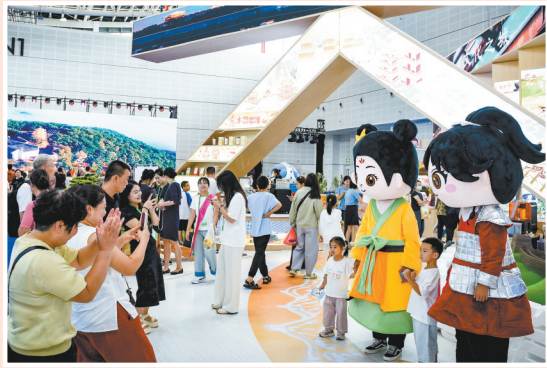
参观者和木兰人偶合影。