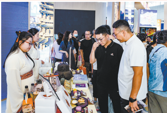
参观者在小南唐北魏茶食展区。