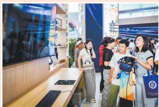
参观者体验云冈石窟VR。