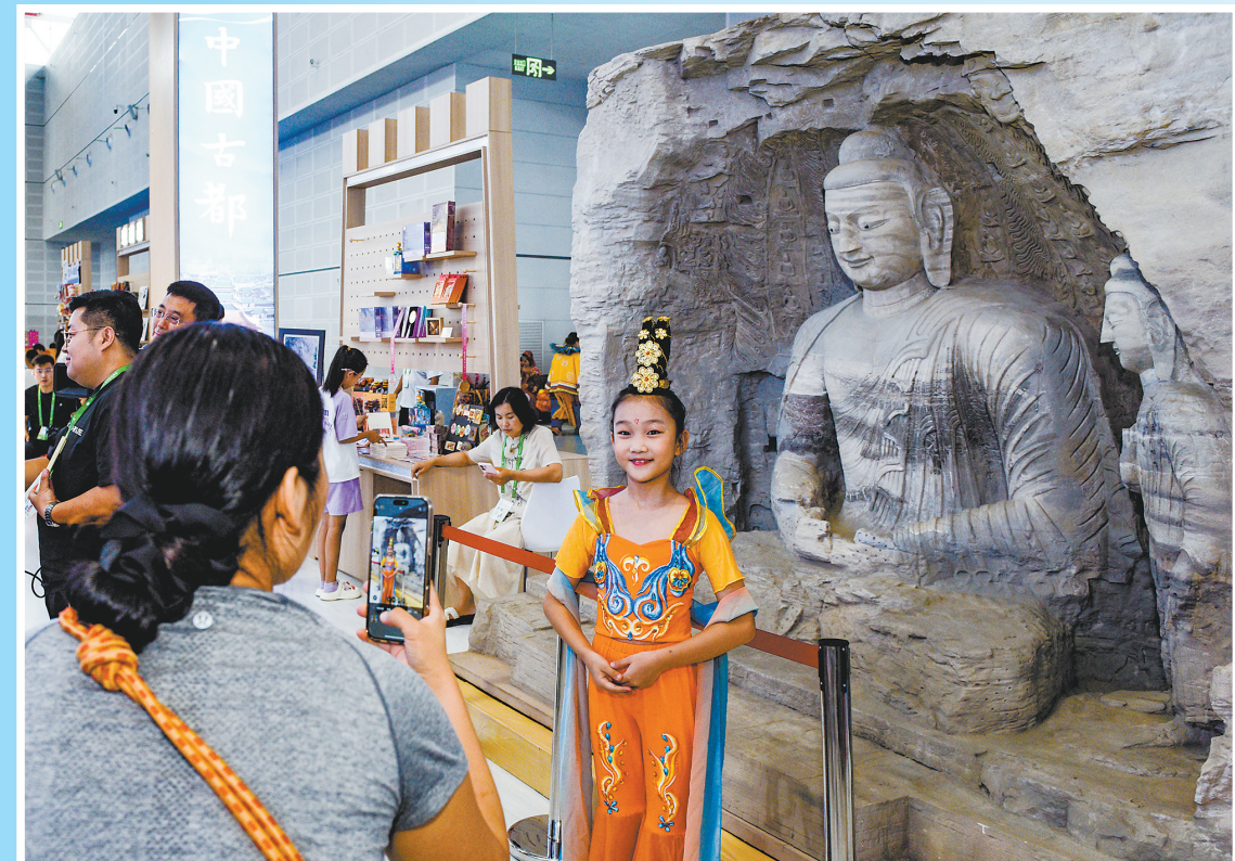
参观者在3D打印的云冈石窟佛像前拍照打卡。