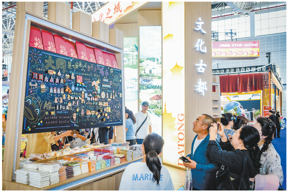
参观者欣赏大同展厅的文创产品。