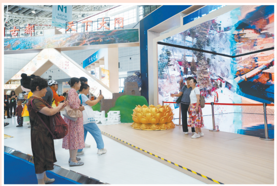
参观者在大同展厅裸眼3D前拍照打卡。