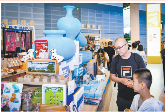
参观者欣赏北魏蓝文创产品。