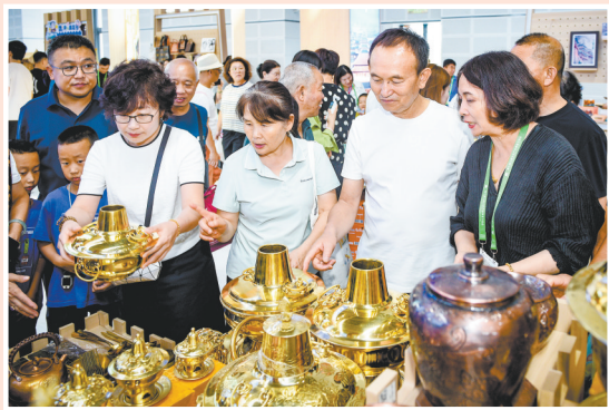
参观者咨询大同铜器。