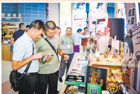
参观者欣赏木兰有礼文创产品。