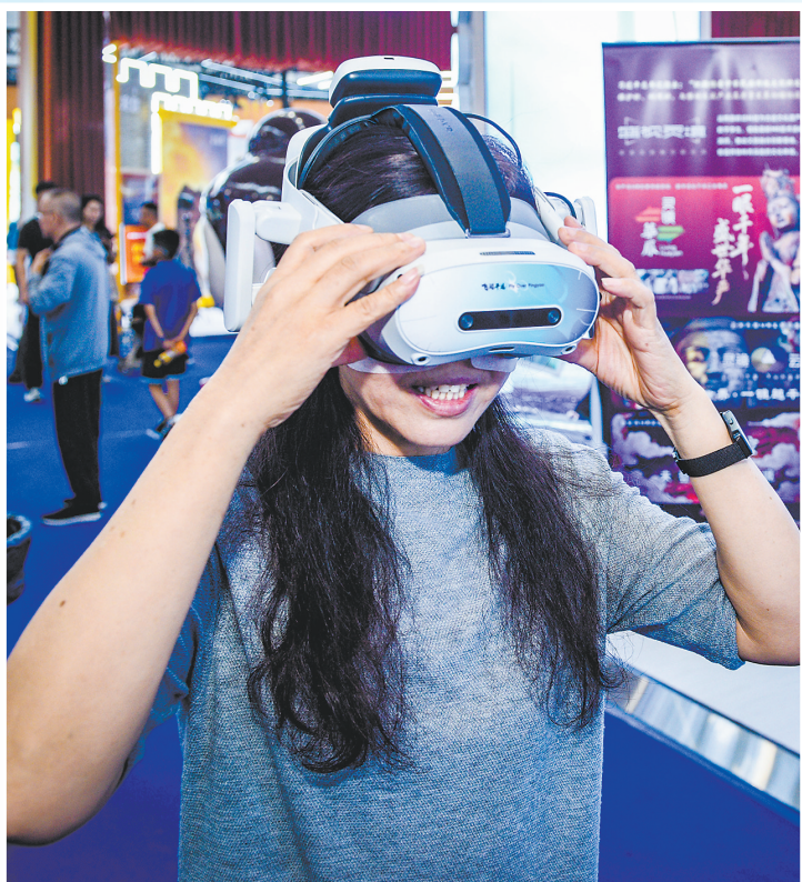
参观者体验华严寺MR。