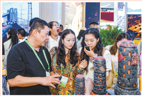
参观者正在了解火山石雕刻产品。