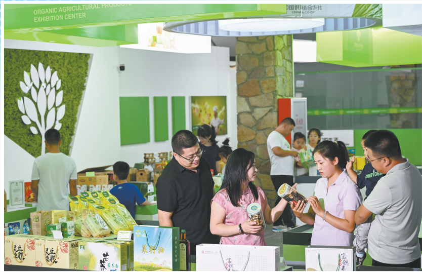
在灵丘县车河村有机商品展示厅,工作人员正在向游客推介有机农作物产品。