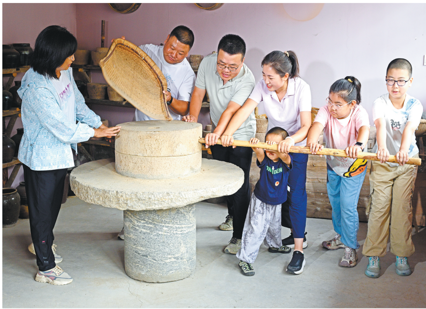
在灵丘县车河村村史馆,游客们正在体验过去的农具。