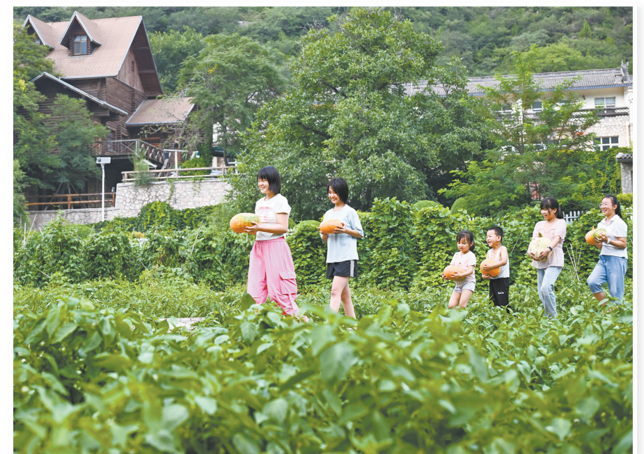
在灵丘县车河村有机蔬菜采摘区,孩子们体验采摘乐趣。