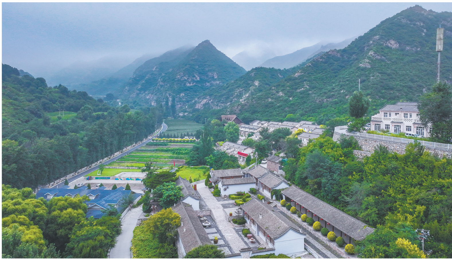
俯瞰车河村,已经是一座现代化新农村。