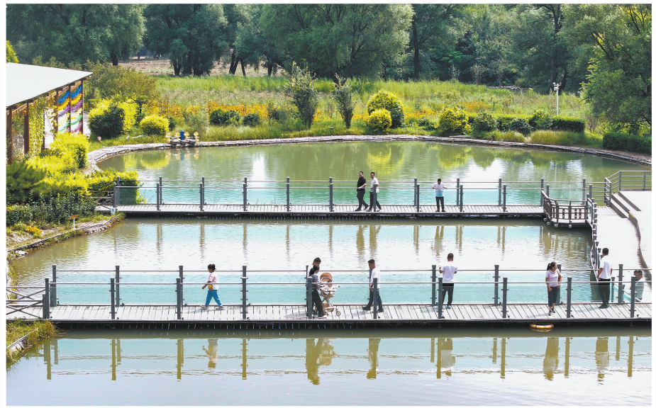
在灵丘县车河村“清水鱼庄”,游客们走进自然与山水共情。