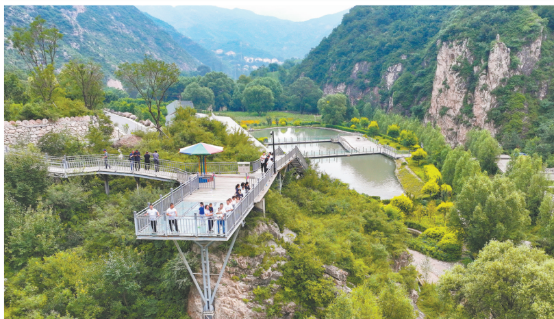
在灵丘县车河村玻璃栈道上,游客们置身青山绿水中,与自然融为一体。