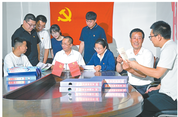
在灵丘县车河村党群服务中心,党员们正在学习乡村振兴理论知识。