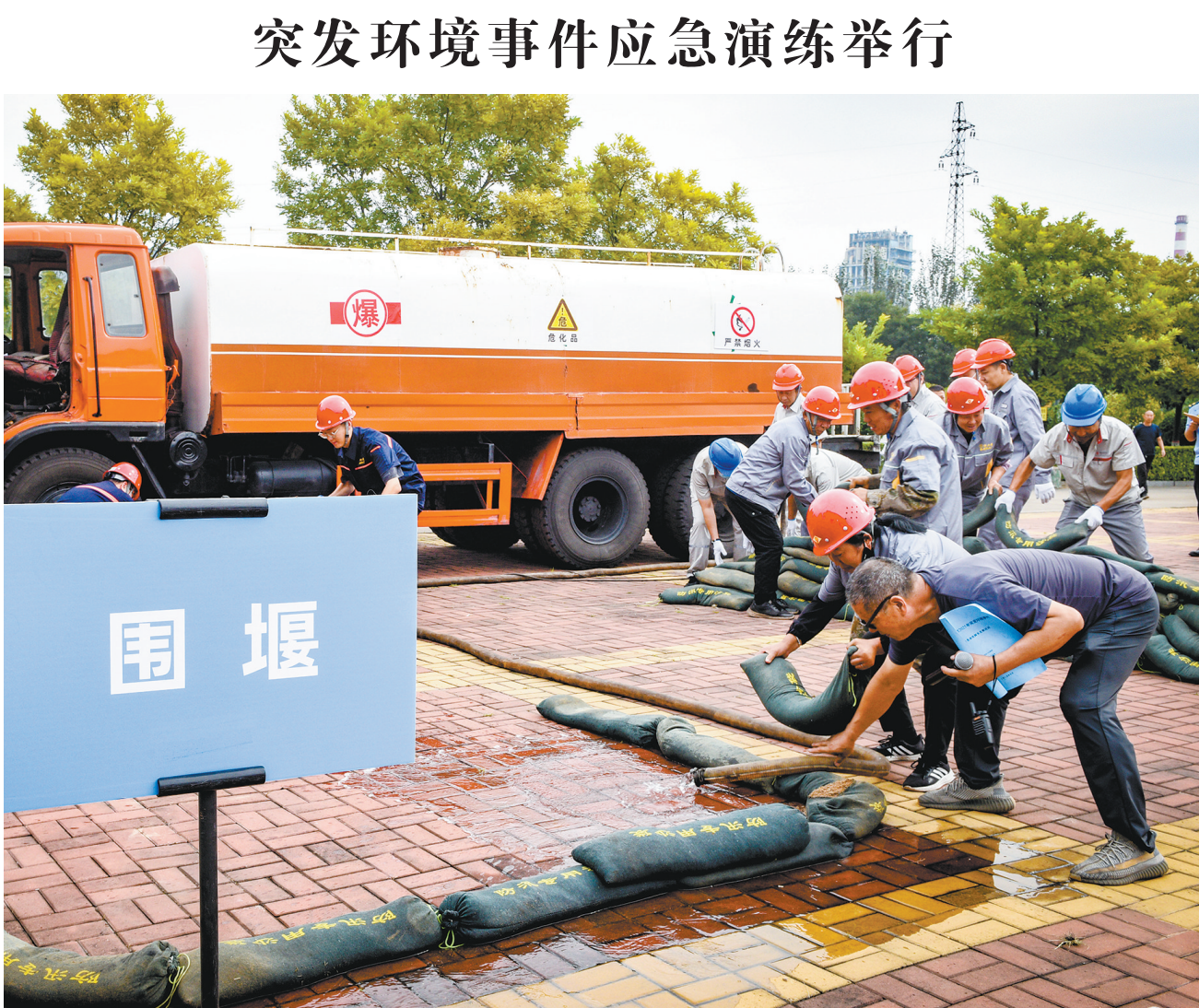
图为应急演练现场，救援队在搭建围堰。

本报讯（记者 王春艳）9月2日，“勿忘国耻 珍爱和平”纪念抗日战争胜利八十周年书画展在大同古城叶茂传统文化园区展览馆启幕。 本次展览由市老年书画家协会主办，通过老年书画爱好者200余幅书画作品，以艺术之笔描绘抗战历史、以丹青之色展现伟大抗战精神，激发市民爱党爱国情怀，丰富市民精神文化生活。展览现场，墨韵飘香，书法作品或以气势磅礴笔触描绘抗战时期激烈战斗场景，或以细腻入微表达对和平的珍视；绘画作品以中国画为主，展现深厚家国情怀和对美好生活的向往。展览吸引众多书画爱好者及广大市民驻足欣赏，大家纷纷表示，要珍惜来之不易的和平，传承伟大抗战精神，汲取奋进力量。 展览将持续至10月8日。