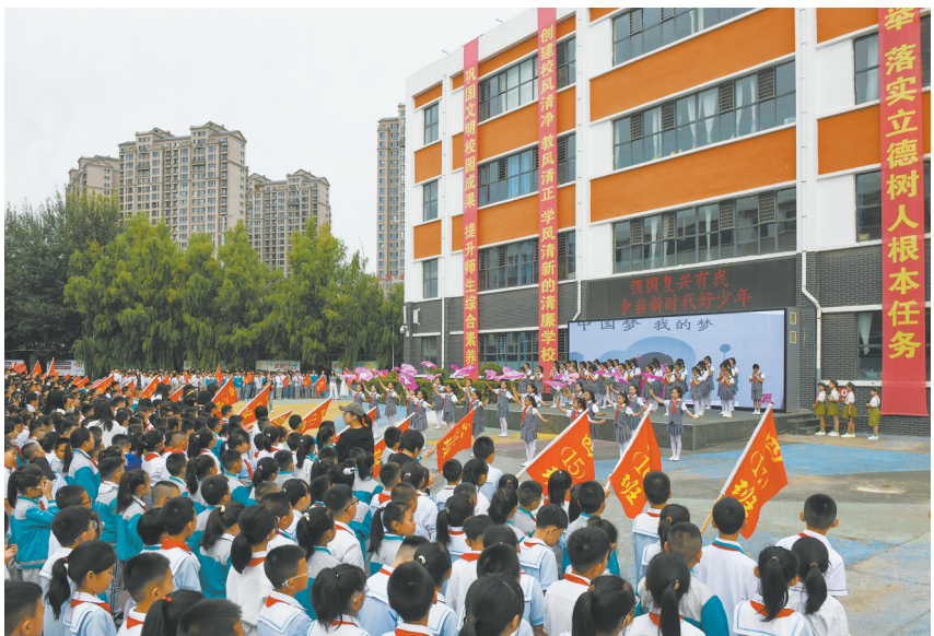
图为平城区14校主题教育活动现场。

现事故、逐级上报、制定处置方案、应急处置等环节展开，检验我市突发环境事件应急预案的针对性、实用性及可操作性，考验锻炼各部门和企业应对突发环境事件的反应能力、应急处置能力和协调作战能力。通过演练，提升我市突发环境事件应急处置水平，进一步强化各级各部门间协同作战的默契度、面对险情的快速响应效率及运用科学方法开展处置工作的专业能力，为后续高效应对各类环境突发风险筑牢实战基础。