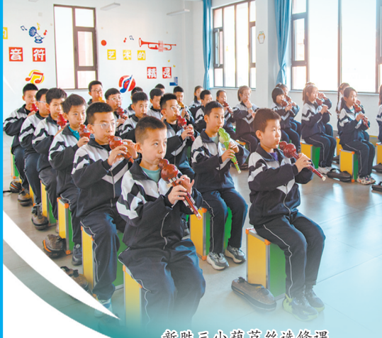
新胜三小葫芦丝选修课。