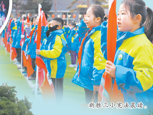
新胜三小宪法晨读。