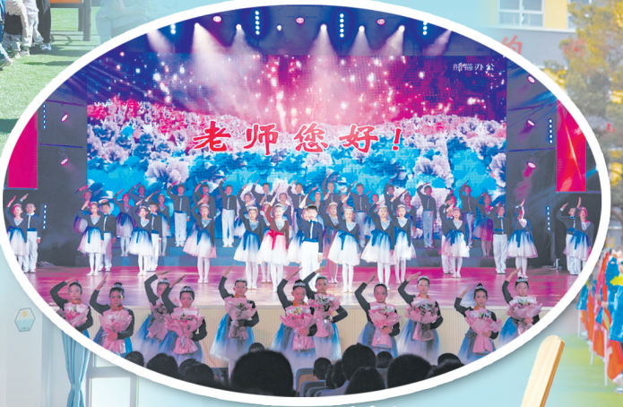
云冈区教师节表彰大会暨文艺汇演活动现场。