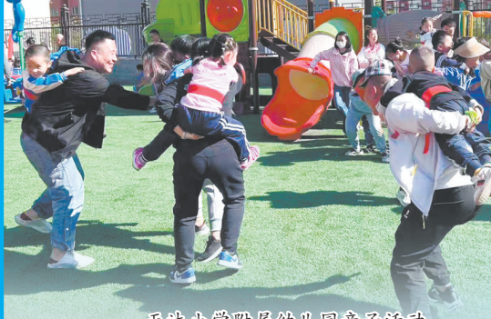
天沐小学附属幼儿园亲子活动。