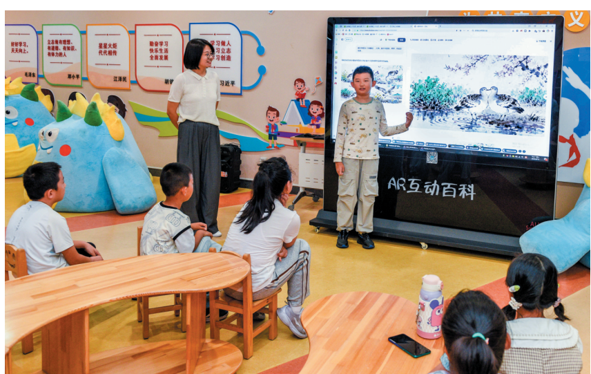
图为“科普在身边·百姓讲堂”系列活动中，小朋友介绍用AI生成的湿地及候鸟图片。

讲座中，杜芳通过精彩的视频和图片，带领观众“云游”桑干河湿地，展示弯弯河流、镜面湖泊和随风摇曳的芦苇荡等自然景观，生动讲解湿地对候鸟迁徙至关重要的作用。在杜芳引导下，孩子们认识了“鸟中大熊猫”东方白鹳，翼展可达3米的卷羽鹁鹑，优雅如芭蕾舞者的天鹅等珍稀候鸟，了解了它们的特征和习性。杜芳鼓励小