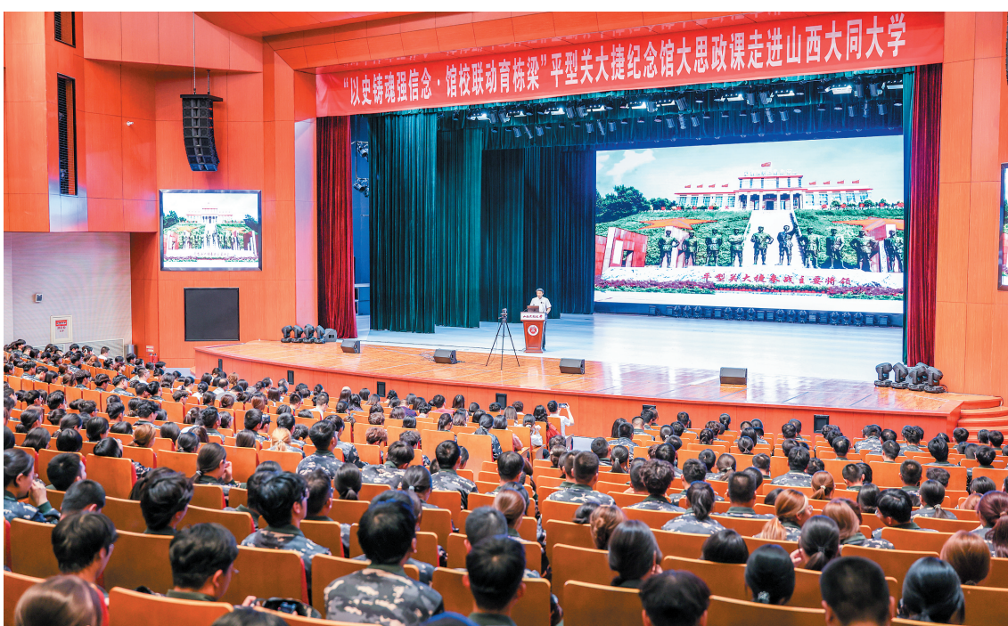
图为平型关大捷纪念馆宣讲团走进大同大学主题宣讲活动现场。

本报讯（记者 丁亚琴）9月12日，平型关大捷纪念馆宣讲团走进大同大学，开展以“铭记首战壮举 传承红色基因”为主题的宣讲活动。此次活动通过线上线下相结合方式，为大同大学2025级新生带来沉浸式思政教育课，引导青年学生铭记革命历史、传承红色基因，厚植爱国爱党情怀。