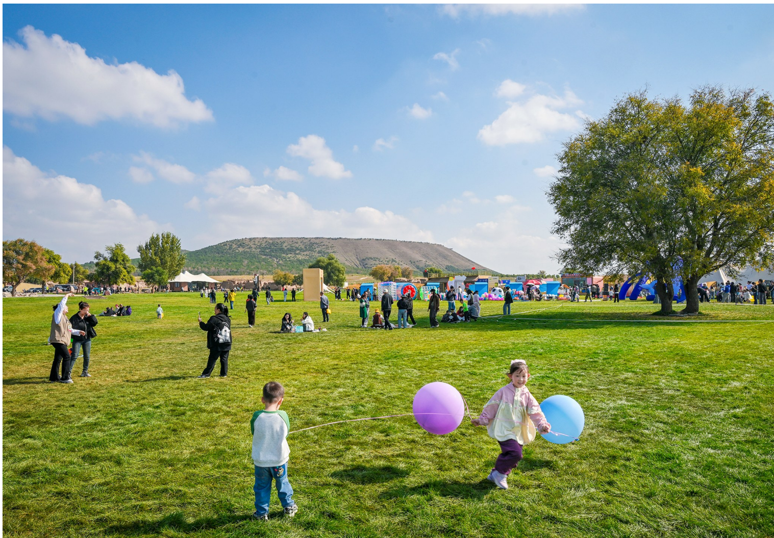
国庆中秋假期，大同旅游热度高涨。云冈石窟、大同古城、悬空寺等景区游人如织，大同火山群国家地质公园亦成热门打卡地。游客漫步于古老遗迹感悟文明脉络，奔赴草坪拥抱自然，眺望壮美火山地貌，在秋日晴空下尽享假日休闲时光。图为热闹的云冈景区黄家洼草坪营地。

畔，摄影爱好者架起相机，静静等待捕捉秋日湖面的晨光与晚霞；城墙带状公园旁，年轻市民铺开野餐垫，分享零食、畅谈生活，伴着秋风与鸟鸣，享受难得的松弛时光。 据悉，连日来，“错峰游”“休闲游”成为市民度假的关键词。市民在乡村的自然风光与人文风情中尽情享受属于自己的假期，实现了“让景”与“享景”的双赢。