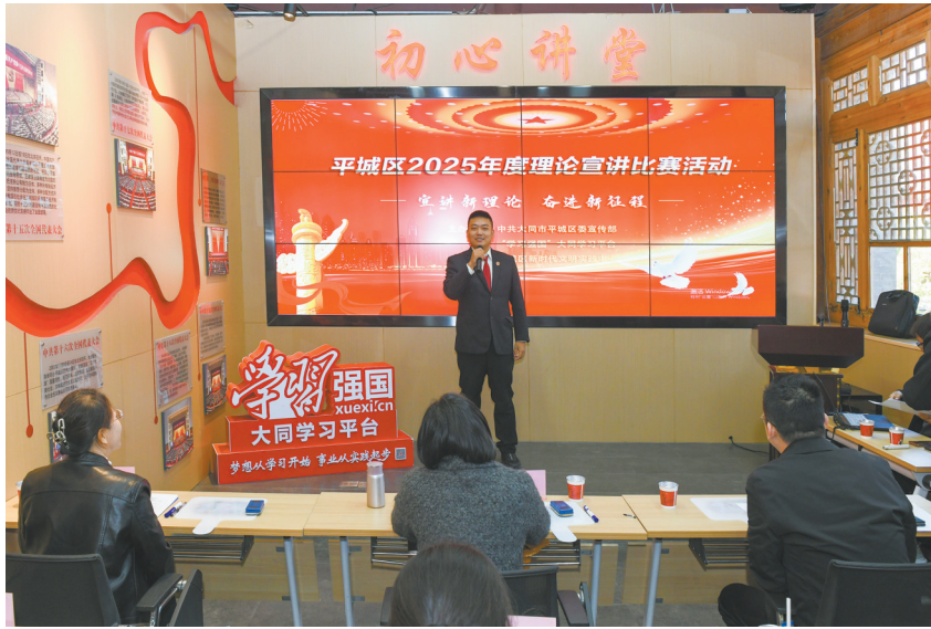
10月14日，平城区委宣传部与“学习强国”大同学习平台共同举办“宣讲新理论 奋进新征程”2025年度理论宣讲比赛决赛。经前期选拔，平城区各机关企事业单位的15名优秀选手站上决赛舞台，围绕主题、结合工作实际展开宣讲，为观众带来精彩的理论“盛宴”。

的工作中，人大代表观察员将以服务企业、民生需求为导向，积极深入企业倾听心声、收集诉求，聚焦企业和群众关切精准发力，为全县营商环境整体水平提升贡献人大力量。该县各相关部门负责人表示，将以此次活动为契机，进一步加强与观察点和观察员的沟通联系，积极改进工作、主动接受监督，不断提升政务服务水平，为市场主体提供更加优质、高效、便捷的服务。