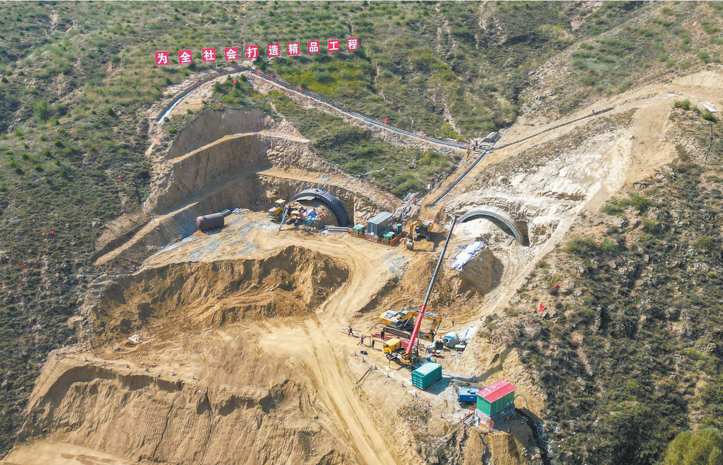
连日来，在国道109线、208线大同过境公路改线工程采凉山隧道工程出口处，装载机、压路机等往来穿梭，一派热火朝天建设景象。

“十四五”时期，从城市到农村，大美云冈颜值更高、品质更好、韵味更足，广大群众的获得感、幸福感、安全感全面提升。