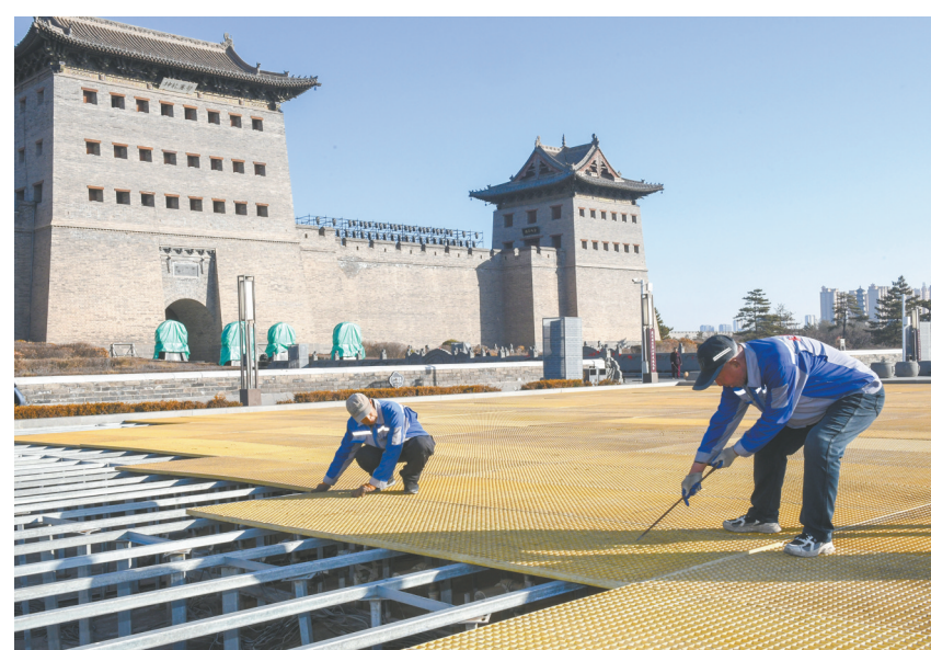
天气渐冷，连日来，山西永泰物业公司工作人员正有序对永泰门广场音乐喷泉开展冬季防护，保障音乐喷泉安全过冬，为来年设备调试和正常运行奠定良好基础。11月13日上午，记者在永泰门广场看到，施工人员正在音乐喷泉池上铺设格栅板，待格栅板铺设完成后再铺设一层装饰网，既可以防止有人意外跌落，还可以起到防寒保暖保护设备以及景观美化的作用。

《佛光下的暖阳》在冬日里快速推进，期待实现“以剧促旅、以旅兴文”的效果。千年文脉与现代活力双向奔赴，我们更期待也深信，将来一定有更多挖掘大同特色、深耕内容创新的微短剧出炉并热播，打造具有辨识度的文化IP，掀起“线上追剧线下打卡”的新风潮，实现从线上观看到线下体验的转化，打通文化消费链条，为我市文化产业、文化之城建设注入新活力，为讲好大同故事、重塑城市形象增加新动能。