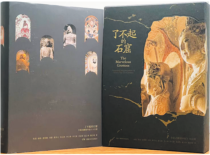
《了不起的石窟》封面

近日，由湖南文艺出版社倾力打造的《了不起的石窟：全景式解读中国十大石窟》震撼上市。这部厚达700余页的巨著，汇聚国内石窟研究权威学者的毕生功力，以300余幅珍贵图片和海量独家内容，为读者开启一场穿越千年的石窟文化盛宴。这不仅仅是一本书，更是一座可以随身携带的“纸上石窟博物馆”。