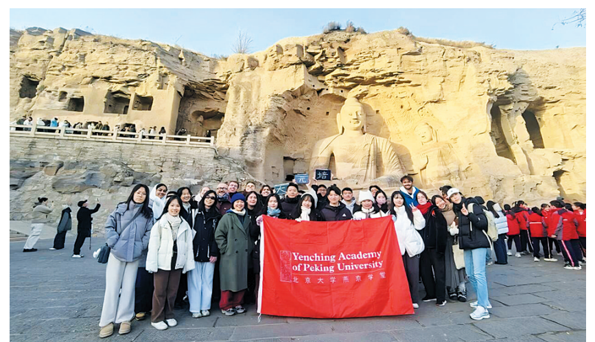
北京大学燕京学堂与元培学院师生在20窟前合影

本报讯（记者 赵喜洋）11月8日，北京大学燕京学堂与元培学院师生组成联合调研团队，赴云冈石窟开展实地学术考察，深入探究云冈石窟所承载的中西文化交融特色。