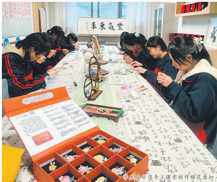
学生在非遗手工课堂制作梅花盘扣

大同一职中负责人表示,本次优异成绩的取得,离不开参赛师生的努力与创新,也得益于校企合作单位的