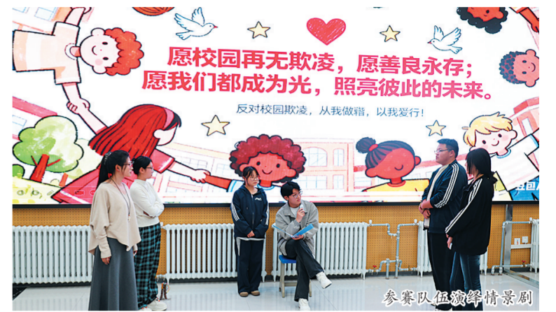
参赛队伍演绎情景剧

本报讯(记者 解慧)近日,大同师范高等专科学校第三届“小教艺彩”杯人文知识竞赛圆满落幕。本次竞赛以“夯实人文底蕴,涵养青年素养”为主旨,不仅为学生搭建了展现知识储备与综合能力的平台,更打造了“党建+育人”的特色实践载体,助力人文精神在校园落地生根。