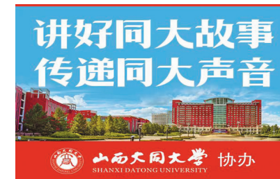
山西大同大学 协办

国式现代化的宏伟蓝图，持续深化“学教研产城”融合，进一步提升人才培养质量、科研创新能力与社会服务水平，在服务区域高质量发展中展现新作为、作出新贡献。