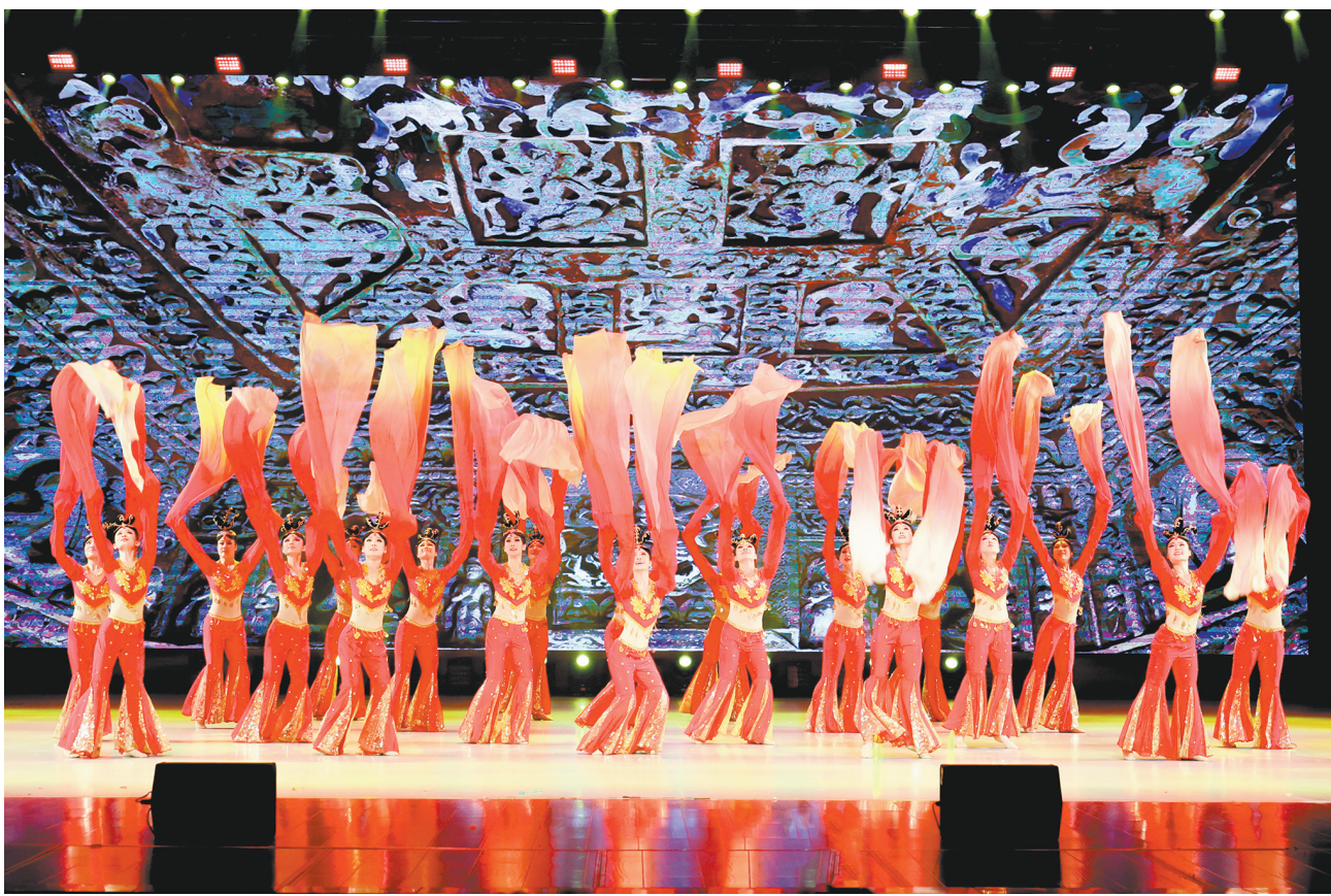
图为舞蹈《云冈长袖飞天舞》。

本报讯（记者 丁亚琴）12月28日晚，大同大学本真楼演播厅灯火璀璨、喜庆热闹，以“骐骥奋蹄开新岁 挺膺担当赴强国”为主题的2026年新年联欢会在此举行，广大师生代表共赏精彩演出，共话美好未来，在欢声笑语中迎接即将到来的新年。 联欢会在舞蹈《同心筑梦 春启新程》中拉开帷幕，演员以优美舞姿诠释团结奋进、启航新篇的美好愿景。随后，武术《武韵新春》刚劲有力，展现中华传统体育精气神；歌曲《像你这样的朋友》温暖真挚，传递同窗情谊与青春力量；朗诵《诗词里的中国》以声传情、