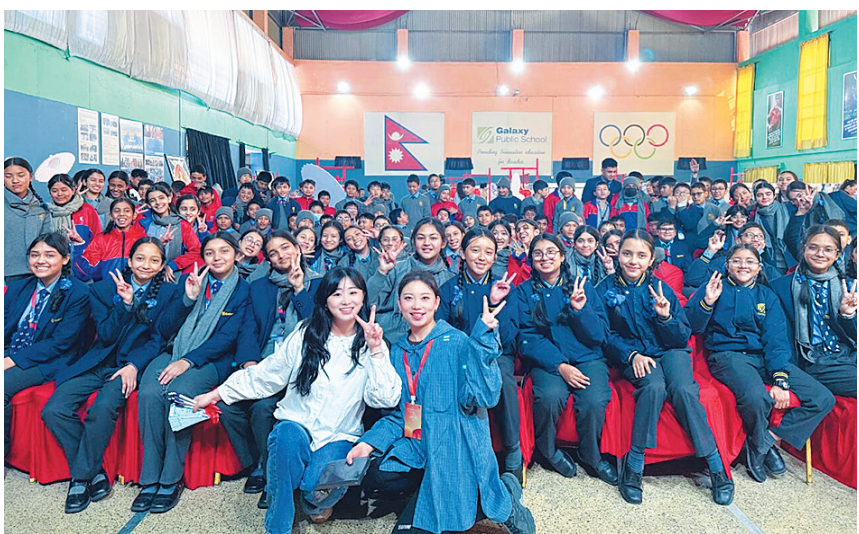
云冈研究院专业人员和尼泊尔加德满都银河学校师生在一起

影响力的鲜活缩影。通过将厚重的历史叙事与前沿的科技传播手段相结合，当地师生不仅领略了中国古代艺术的瑰丽，也感受到了当代中国在文化遗产保护、研究与创新传承方面的不懈努力，有效增进了尼泊尔民众，尤其是年轻群体对中国文化的认知与亲近感，为巩固中尼传统友谊、夯实两国关系注入了鲜活力量。