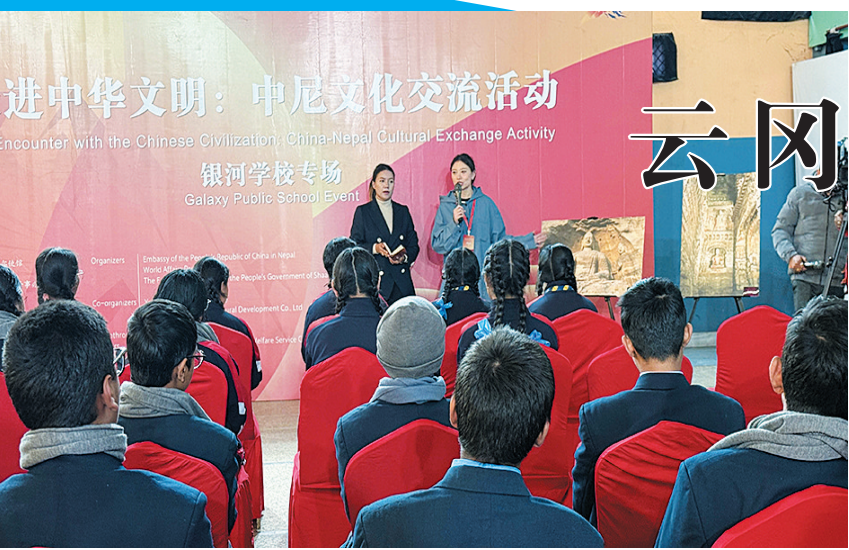
“走进中华文明”文化交流活动在尼泊尔首都加德满都举行

本报讯（记者 赵小霞）2025年12月27日，中尼建交70周年系列活动开幕招待会暨“走进中华文明”文化交流活动在尼泊尔首都加德满都举行。本次活动由中国驻尼泊尔大使馆、世界知识出版社、陕西省人民政府外事办公室联合主办，得到中国红十字公益基金会、云冈研究院、国文馆（北京）文化发展有限公司等单位支持。尼泊尔联邦议会众议院副议长英迪拉·拉纳、中国驻尼泊尔使馆临时代办周攀、尼政府官员、多国驻华使节、国际组织代表及在尼泊尔华侨等800余名各界人士出席。