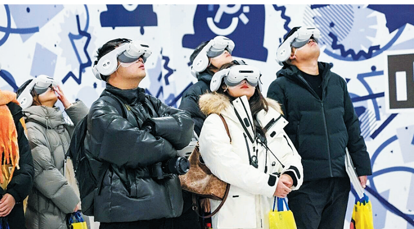
沉浸观展，体验多元

世界文化遗产云冈石窟2025年参观人数突破528万人次，同比增长18.87%，创历史新高。