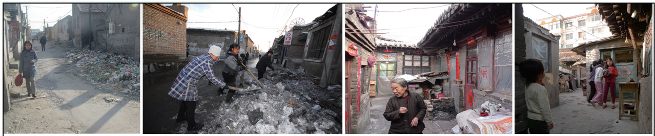
改造前的古城街巷院落。