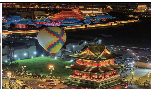
代王府和太平楼夜景醉游人。