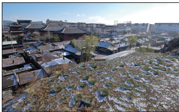
远眺修复前的善化寺。