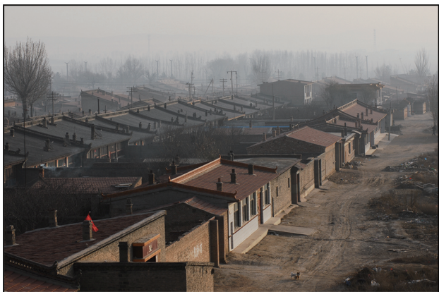
改造前的古城街巷。