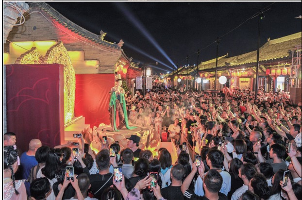
东南邑历史文化街区游人如潮。

当站在巍峨雄壮的大同古城墙上俯瞰，青砖黛瓦的古城街巷整齐铺展、里坊井然，在阳光下泛着内敛而温润的光；华严寺、善化寺等古刹的斗拱飞檐尽显古典风骨；古城墙下的非遗市集里，生动鲜活的市井烟火与千年文脉交融，八方游客的欢笑从街角的广场传来，与檐角风铃的清音交相辉映。在世人赞许的目光中，古都大同尽显气度轩昂，典雅内蕴。