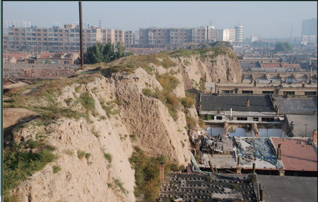
修复前后的东城墙。