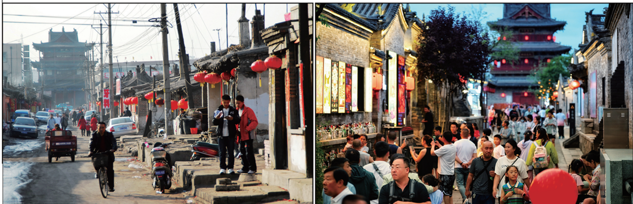
改造前的鼓楼东街。