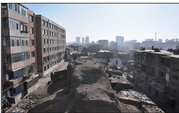
修复前的南城墙(局部)。