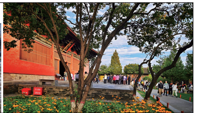
周边环境的多年整治，让千年古刹善化寺重现庄严古朴。