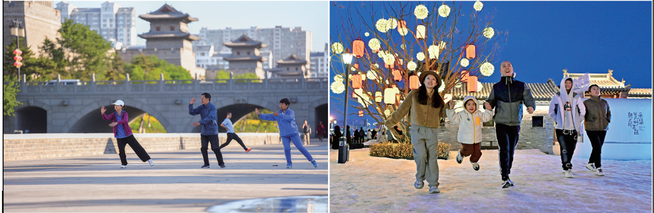
古城街巷广场成为市民游客休闲好去处。