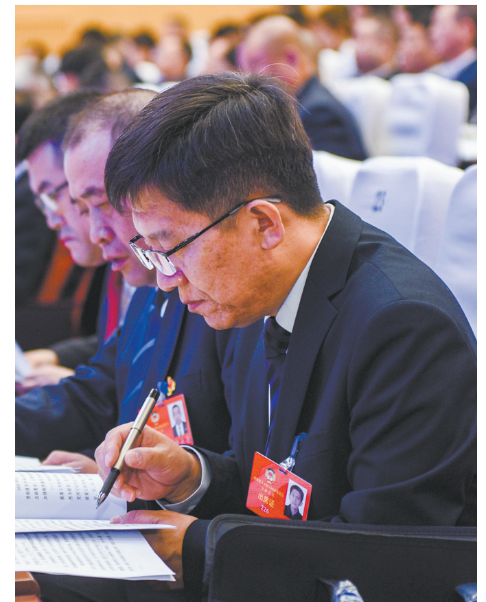
▲1月19日上午,中国人民政治协商会议第十五届山西省大同市委员会第五次会议开幕。图为委员们认真聆听政协常委会工作报告。