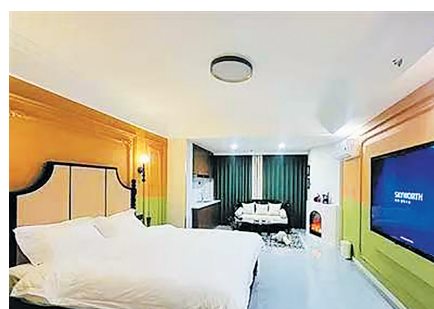
常态化发展的黄金时代。

在“扫尘迎新”的传统习俗驱动下，家政市场的新变化不仅反映了市民消费观念的升级，也预示着该行业正迈入规范化、