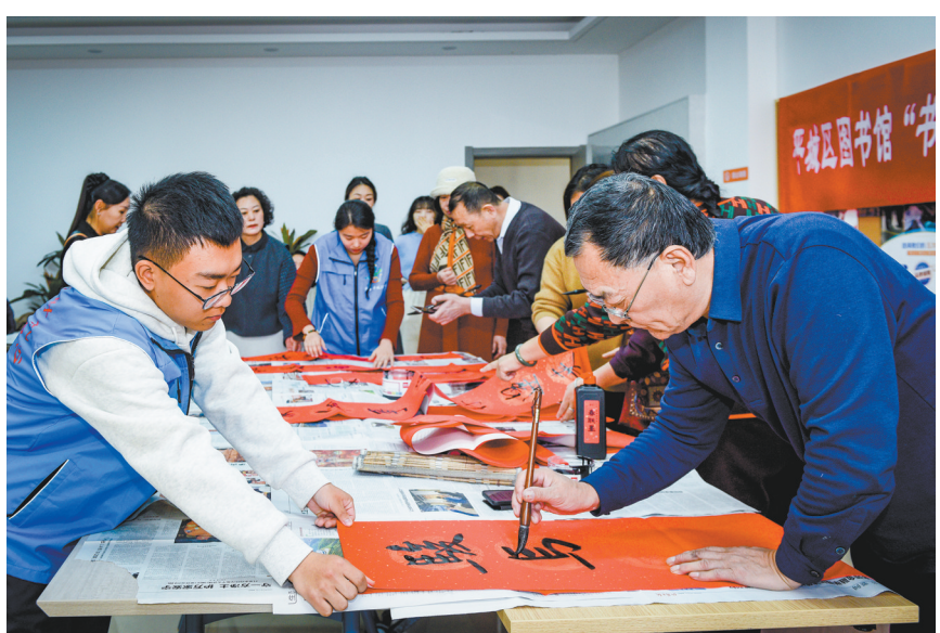
图为书法家走进平城区开源街道民慧社区挥毫泼墨，为居民书写春联。

本报讯（记者 王春艳）1月27日，平城区图书馆“书香添年味 妙笔绘春辉”春节主题活动在平城区开源街道民慧社区举办，邀请书法家现场写春联、送春联，为基层群众送上新春美好祝福。 此次活动是平城区图书馆践行文化惠民宗旨的生动实践，活动紧扣马年新春主题，以春联书法为文化载体，将传统文化与节庆氛围相结合，采用现场书写和成品赠送两种形式，开展送春联进社区、进乡村、进消防惠民活动，推动文化建设提质增效，切实提升基层群众的文化获得感与幸福感。在民慧社区活动现场，书法家挥毫泼墨，笔走龙蛇，大红春联、墨汁清香与阵阵笑语交织成新春序曲，“骏马奔腾开景 春风浩荡展宏图”“玉马迎春春入户 金狗送福福满门”等寓意美好的联句跃然纸上，作品或端庄遒劲，或流畅洒脱，或古朴厚重，营造出浓厚的文化艺术氛围。