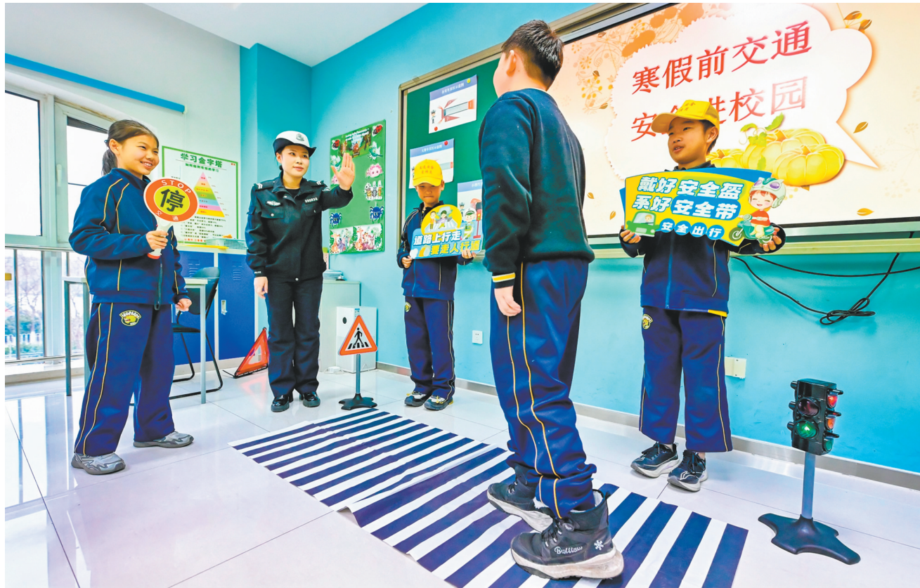
1月28日，天津市公安局滨海新区分局交通管理支队民警在天津市海嘉学校带领学生进行交通模拟体验。 1月28日，天津市公安局滨海新区分局交通管理支队民警走进天津市海嘉学校，为学生讲授交通安全课，增强学生交通安全意识和自我防护能力。

本报讯（记者 田雁）记者昨日从市招考中心获悉，我省2026年上半年高等教育自学考试省内转考、省际转出申请时间为2月2日8时至5日18时。我省在籍考生可根据自身工作、学习实际情况网上申请。 此次自考省内转考、省际转出均在山西自学考试信息平台办理，省内转考完成网上申请即可，省际转出须完成网上申请、网上确认两个环节。完成省际转出网上确认后，考生要及时关注审核状态，审批未通过的，可在规定时间内重新进行网上申请，重新申请机会只有一次；网上确认未通过的，可在规定时间内重新上传资料进行再次确认。未在规定时间内完成转考网上确认的，视为自动放弃本次转考申请。省内转考办理结果考生可于理论课报名期间在平台查看，当省内转考一经办理成功，必须在转入地市参加考试。 申请省际转出的考生，须在转入省（市、区）取得至少一门课程合格成绩，并取得转入地考籍后，才能提出转考申请。因违反有关考试管理规定被停考或延迟毕业的考生，已取得某专业全部课程合格成绩的考生，办理转入手续未满足一年的考生，均不得转出。同时，免考取得的课程合格成绩不得转出；未通过理论课程考核的，其对应的实践环节考核成绩不得转出；毕业论文成绩不得转出。