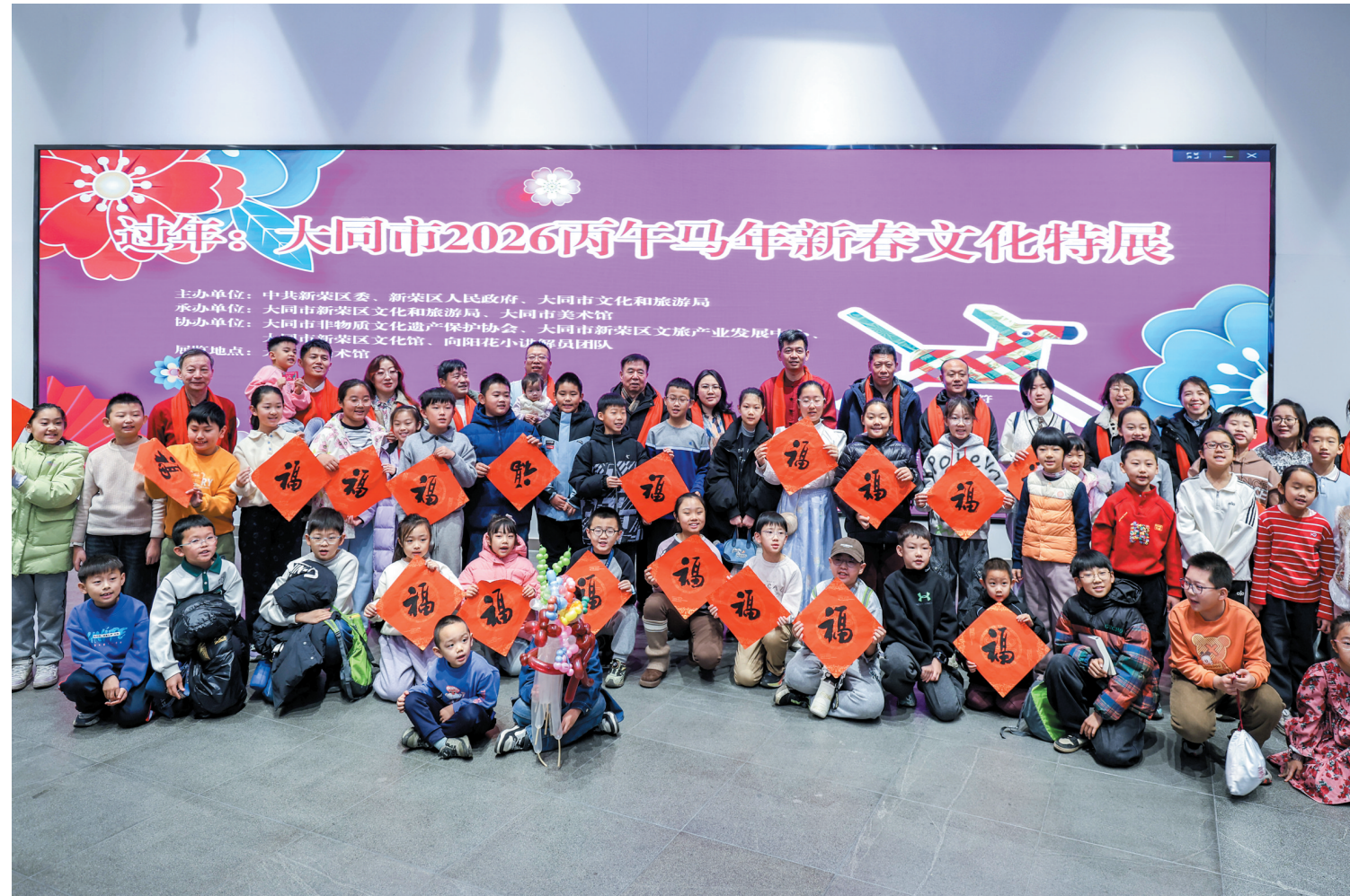
1月31日上午，大同市2026丙午马年新春文化特展在市美术馆拉开帷幕。此次展览为期1个月，以“过年”为核心，设“马年大吉”“非遗万象”“互动华章”三大篇章，融合马文化与新春非遗，打造沉浸式体验，全方位展现大同深厚文化底蕴与浓郁新春年味。