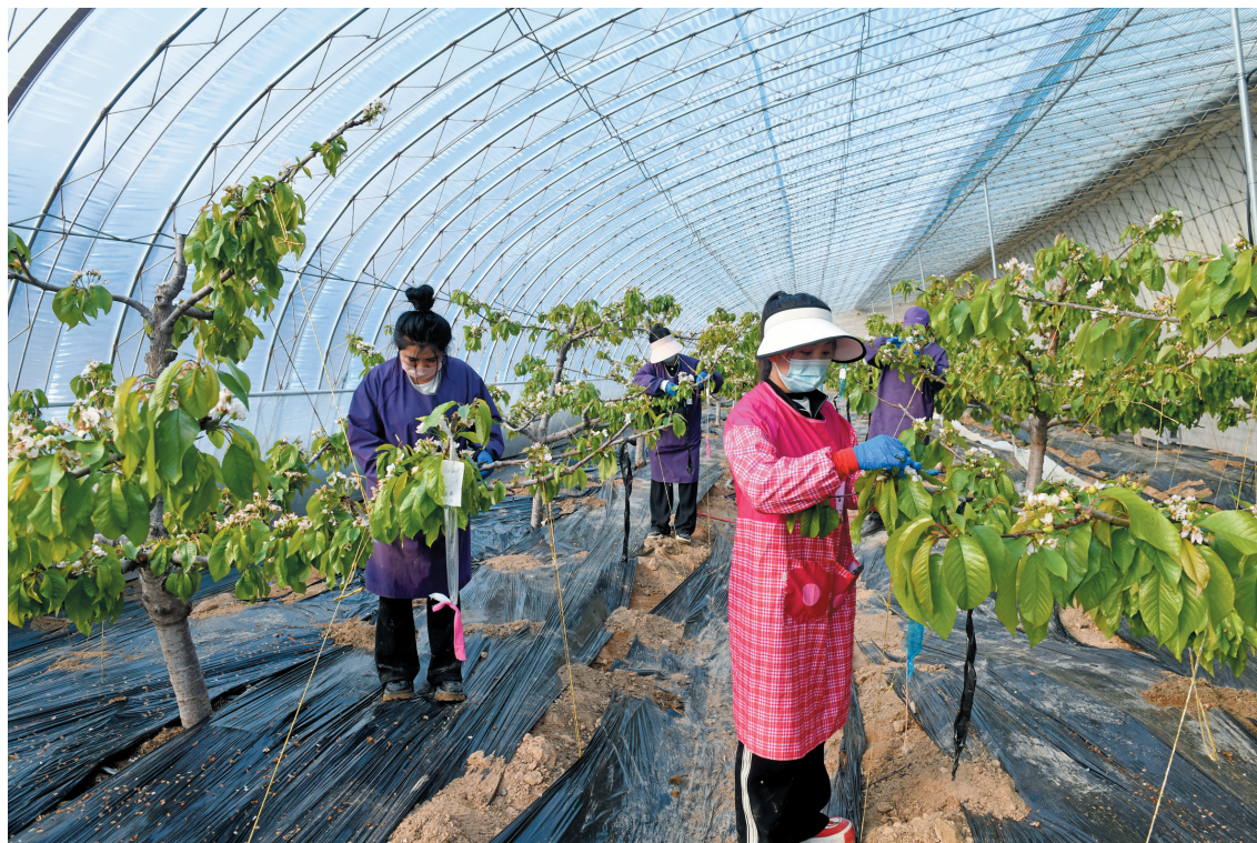
图为在大同蓝海大樱桃种植基地内，工人们正在“洗果”。

隆冬时节，在云州区聚乐乡聚乐村和五里台村的大同蓝海大樱桃种植基地，一派融融暖意与勃勃生机。记者走进第一批升温的樱桃大棚，一股温热的气息裹着清甜的果香扑面而来。樱桃果实缀满枝头，青嫩的果皮泛着浅淡红晕，在阳光下透着水润的光泽。